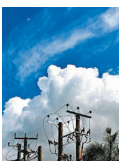
◆每年6、7月之後，南風吹起藍天呈現；立秋之後8月，天天幾乎藍天白雲。

鳥語花香，蝴蝶翩翩四方 朵朵白雲，飛向我的故鄉 田野蒼翠，一片麥浪 看那東方鮮紅的朝霞 歌唱我的故鄉