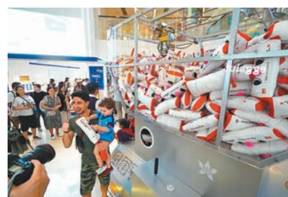
香港航空免費送出逾千張經濟艙機票予全港市民。圖為Fashion Walk的夾公仔遊戲。

香港文匯報訊（記者唐文）香港航空今明兩天舉行「航點新推：機票大放送」活動，免費送出逾千張經濟艙機票予全港市民，目的地包括該公司今年開通的4大新航點：北京（大興）、福岡、布吉及名古屋，以及其他傳統熱門航點如峇里、曼谷、台北、東京、三亞、上海等。有意參加者須於今明