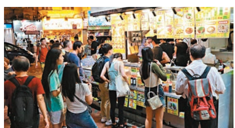
腦場附近小食店舖擠滿顧客。

邵家輝表示，是次夜市活動與附近一帶食肆和店舖合作，不但是腦場專項活動，聯同附近商戶提供優惠，可帶旺整個區域兼增加活動氣氛。特區政府與旅遊發展局等應加強宣傳這類活動，如在社交平台向旅客提供有關資訊，除旅遊局網頁外，小紅書作為內地旅客遊港指南，可以利用該平台宣傳。