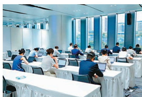
國泰航空首次在內地市場招聘空乘人員，圖為應聘者在進行語言測試。

國泰航空計劃招聘200至300名內地空乘，明年，國泰所招聘的內地空中乘務員人數將會開放至400名至500名，並於2025年