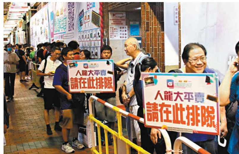
腦場門外有不少人排隊參與「人龍大平賣」活動，購買半價產品。