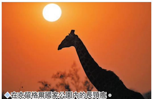
◆在克留格爾國家公園內的長頸鹿。