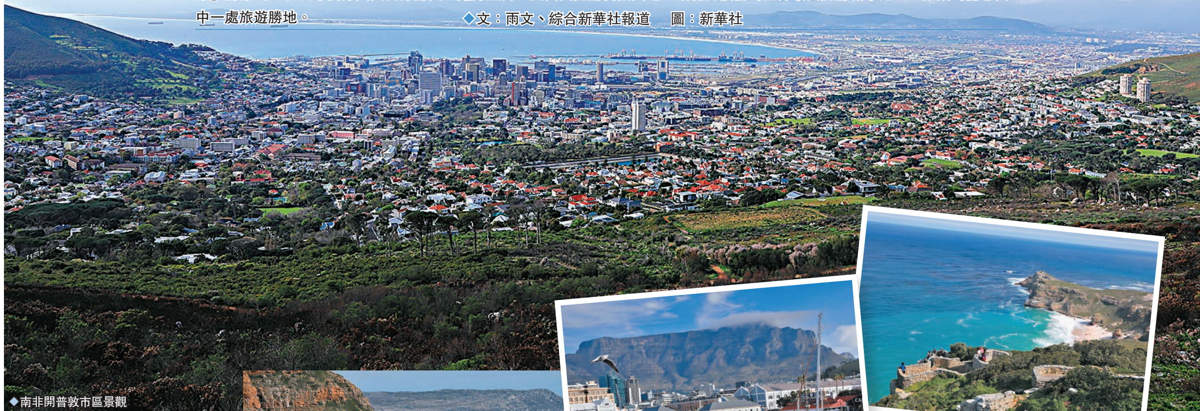
◆南非開普敦市區景觀

開普敦，亦稱好望角市、地角市或開普城，是南非人口排名第二大城市，也是開普敦市大都會自治市組成部分、西開普省省會。開普敦為南非立法首都，因此國會及很多政府部門亦坐落於此。這城市最初是圍繞着碼頭來發展，因為由荷蘭開往東非、印度及亞洲的商船都會路經此地作補給，久而久之便成為歐洲人在撒哈拉以南非洲地區的首個長期聚居點。其後歐洲人亦建立了他們的第一所軍事基地好望堡（Castle of Good Hope），在約翰內斯堡的建立以及川斯瓦發現大量的黃金與鑽石之前，開普敦是非洲南部最大的城市。