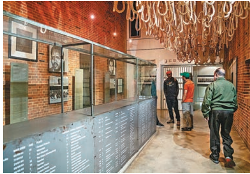
◆遊客在種族隔離博物館參觀。