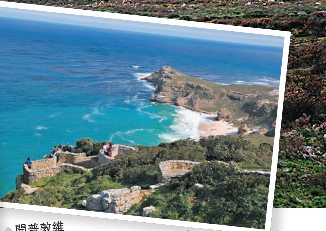
◆開普敦維多利亞港與桌山景觀