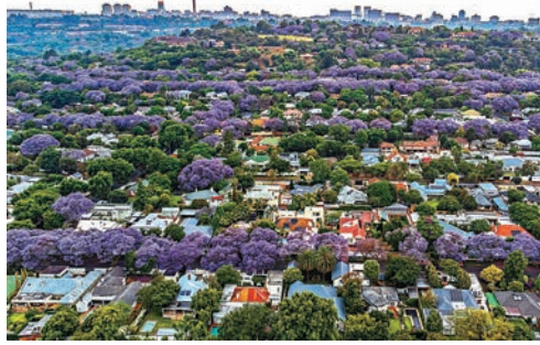
◆每年10月，約翰內斯堡藍花楸盛開。