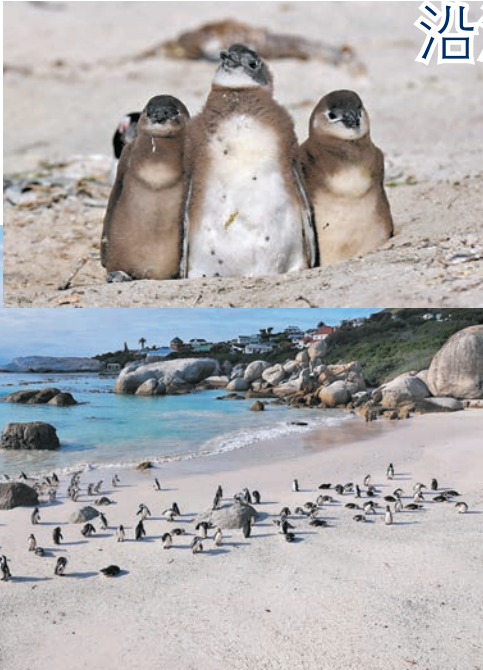
◆在南非西蒙鎮的博爾德斯海灘上的非洲企鵝。