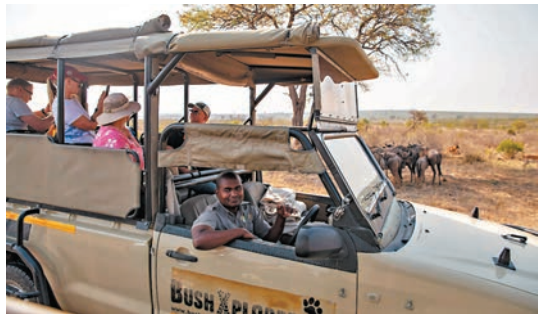
◆在南非克留格爾國家公園，遊客乘坐越野車觀看動物。