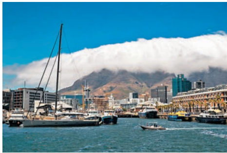
◆遊客在開普敦的一處海濱碼頭遊覽。