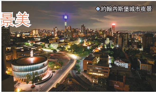
◆約翰內斯堡城市夜景

而且，約翰內斯堡城市夜景優美，當中位於約翰內斯堡市西南角的種族隔離博物館，於2001年建成並向公眾開放，館內展示有文字、圖片、視頻和實物，並以豐富的史料和實物揭露了南非種族隔離時期的黑暗，同時也展示了南非結束種族隔離政策12年以來，這個曾經推行臭名昭著的種族隔離制度的國家如何從「黑白分明」發展成一個「彩虹國度」。