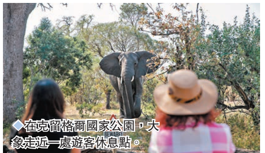
◆在克留格爾國家公園，大象走近一處遊客休息點。