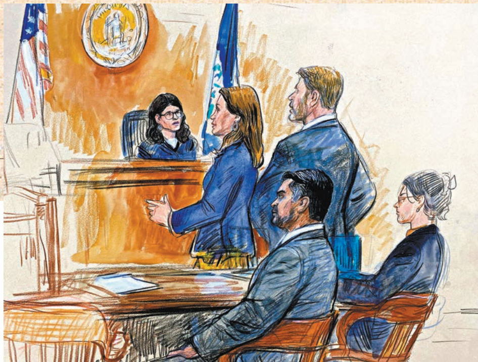
美國前海軍情報官巴亞特普爾(左)就性騷擾案受審。

今次控訴浪潮始於美國前海軍情報官巴亞特普爾被控性騷擾案。去年7月，39歲的巴亞特普爾在CIA總部一個樓梯間性騷擾一名女職員，他用圍巾圍住對方的脖頸，並嘗試強吻她。受害女子事後即時向CIA投訴，不久後又向聯邦調查局(FBI)和當地執法部門報告事件，然而巴亞特普爾事後仍在CIA工作一年有餘。法官裁定巴亞特普爾罪成，判處他緩刑6個月，沒收所有槍支，且不得再接觸受害女子。