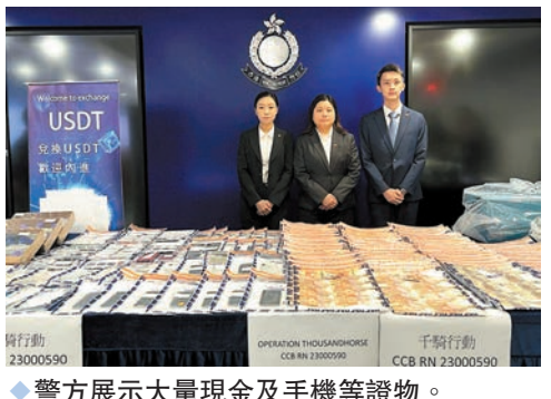
◆警方展示大量現金及手機等證物。

骨幹及6名傀儡戶口持有人，其中3名是非華裔女子，部分人有黑社會背景。他們分別報稱任職建築工、售貨員、保險經紀、家傭及無業等，涉嫌「洗黑錢」及「詐騙」罪被扣查。