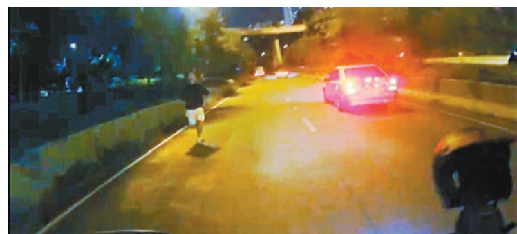
◆有車Cam片段拍到當時一名涉事男子在葵涌道往荃灣方向馬路反方向奔跑。網上片段

煙及1支照明彈外，亦發現該車行車證已於去年8月16日過期，該名司機較早前亦涉及一宗超速案件正在停牌，並因欠交罰款而被通緝。警方遂以狂亂駕駛、駕駛未獲發牌車輛（行車證過期）、駕駛時未有第三者風險保險、停牌期間駕駛、欠交法庭罰款、藏有未完稅香煙及藏有危險爆炸品，合共7宗罪將其拘捕，並設法緝捕同車在逃一名男乘客歸案。