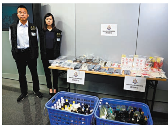
◆警方在行動中拘捕68人並檢獲大量證物。

另外，警方亦揭破一個非法收債集團，拘捕10男3女，部分人有黑社會背景。他們分別負責上門淋紅油，以及「吉儀」放入債仔的個人資料及收數信滋擾受害人的家人或債仔，又以電話恐嚇等行為進行非法