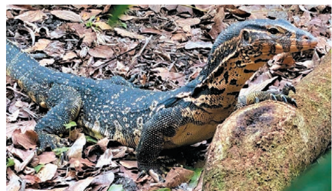
◆有消息指嘉道理農場走失水巨蜥已尋回。F6圖片

香港文匯報訊 嘉道理農場暨植物園早前走失一條水巨蜥，事發逾兩周，有消息指涉事水巨蜥終於尋回。據報道，涉事水巨蜥由行山人士在嘉道理農場內發現。根據事主提供的相片，巨蜥表面並無傷痕，大致健康良好。