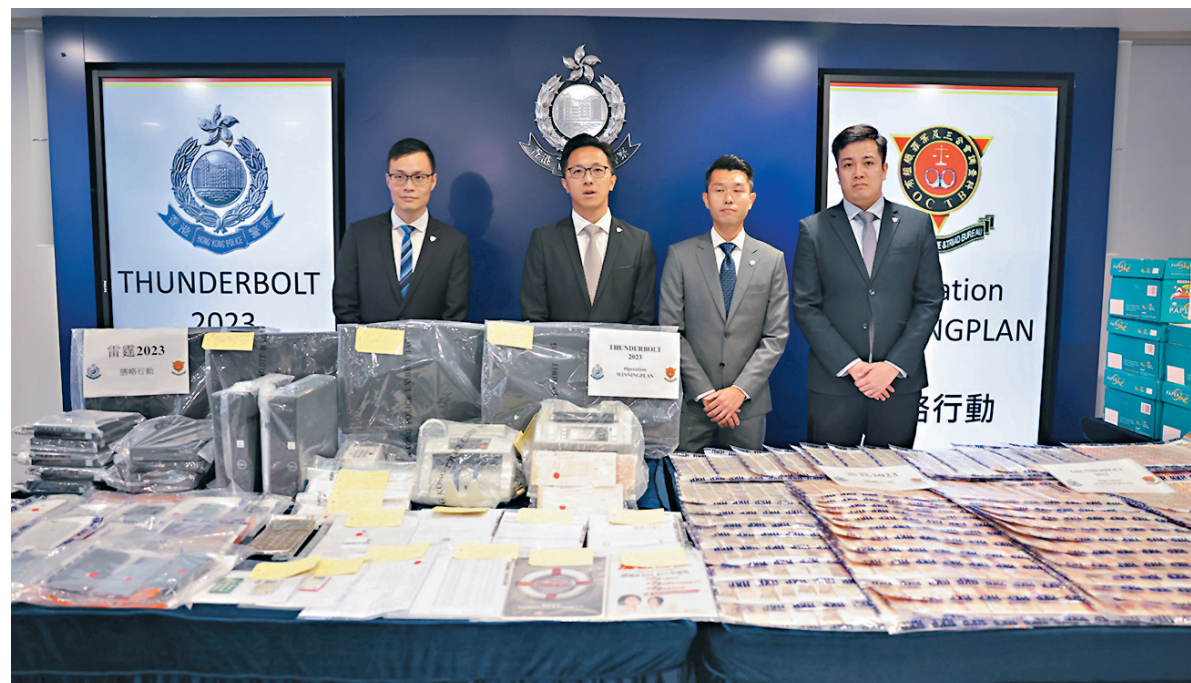
◆O記反黑拘83人，檢大量現金、電腦及手機等證物。

上週四（24日），警方聯同公司註冊處人員在借款人將款項交予「收數仔」時，突擊搜查兩間持牌放債人公司，以及集團骨幹成員的住所和位於一個私人住宅的「收數中心」，合共拘捕14人，當中包括6名集團骨幹成員、4名公司職員及4名「收數仔」。另又檢