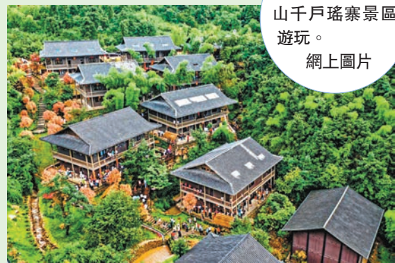
◆遊客在雲冰山千戶瑤寨景區遊玩。網上圖片