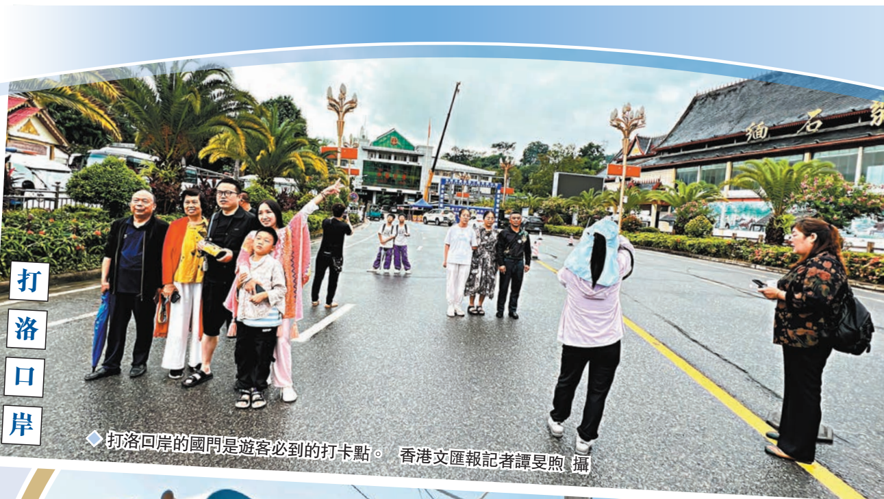
◆打洛口岸的國門是遊客必到的打卡點。