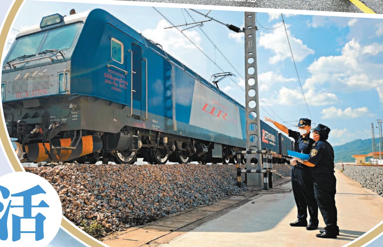
◆海關人員正對中老國際貨運列車進行查驗。