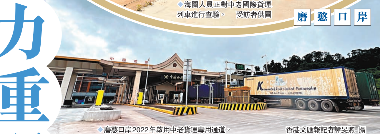
◆磨憨口岸2022年啟用中老貨運專用通道。