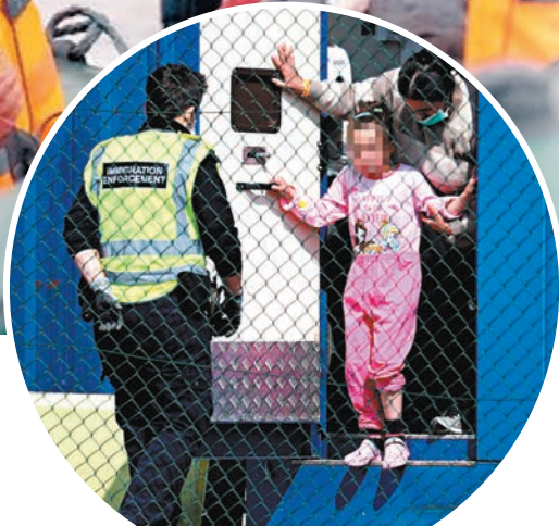
◆英官員稱評估難民年齡有難度。圖為執法人員協助一名少女入境。

政府一名發言人辯稱，評估年齡是一個具挑戰性但重要的過程，可識別真正的兒童，並阻止非法入境者濫用庇護制度，「我們須防止成年人自稱是兒童，或兒童被錯誤地當作成年人對待，這兩者都會帶來嚴重風險。為了進一步保護兒童，我們正通過使用X光檢測等科學措施，來加強年齡驗證過程。」