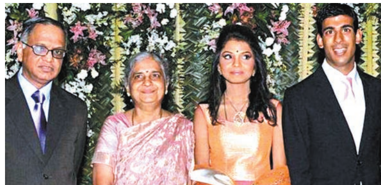
◆蘇納克(右)與妻阿克沙塔(右二)家族合照。阿克沙塔父親(左)為Infosys創辦人之一。

蘇納克早前便捲入一宗涉及利益衝突的爭議，其妻子持有的一間育兒服務企業受益於新的政府政策，但蘇納克因未有正確申報妻子持股，而受到國會標準監管機構譴責，但認為蘇納克只是疏忽所致。