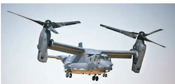
◆墜毀同型號V-22魚鷹傾轉旋翼運輸機。

澳洲是美國在太平洋的重要夥伴，目前約有150名美軍海軍陸戰隊員駐守在達爾文，每年有2,500人輪替。這是在今年在澳洲發生的第3宗軍機墜毀事故。3月份一架MRH-90直升機在新南威爾士州進行反恐演習時墜海，10名澳軍人獲救；上月美澳進行一次大型軍演期間，一架MRH-90直升機墜落昆士蘭州沿岸，造成4名澳洲士兵死亡。