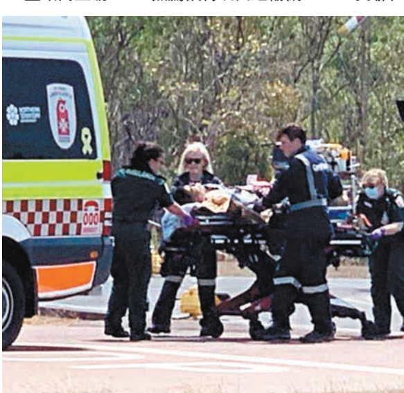
◆救援員將傷者送院。網上圖片