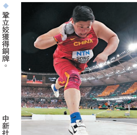
◆鞏立姣獲得銅牌。