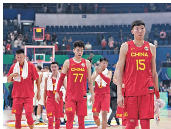
◆中國男籃出線形勢平。