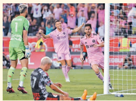
◆美斯(右)在完場前建功。

至於至今上陣9場射入11球的美斯，賽後在個人社交平台慶祝勝利，表示球隊在美職聯取得了出色勝仗。而美斯的球王級表現亦已完全征服其邁阿密隊隊友，其中小將阿倫便表示：「美斯真的是十分奇妙的人，能夠與他並肩作戰真的是我的榮幸。」