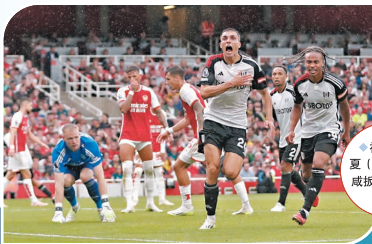
◆祖奧包連夏(前)替富咸扳平。