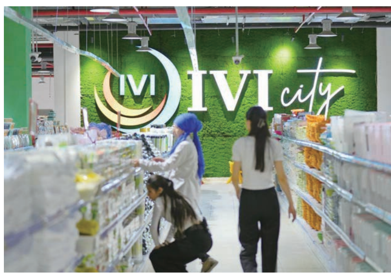
◆ 哈薩克斯坦的「中國超市」。