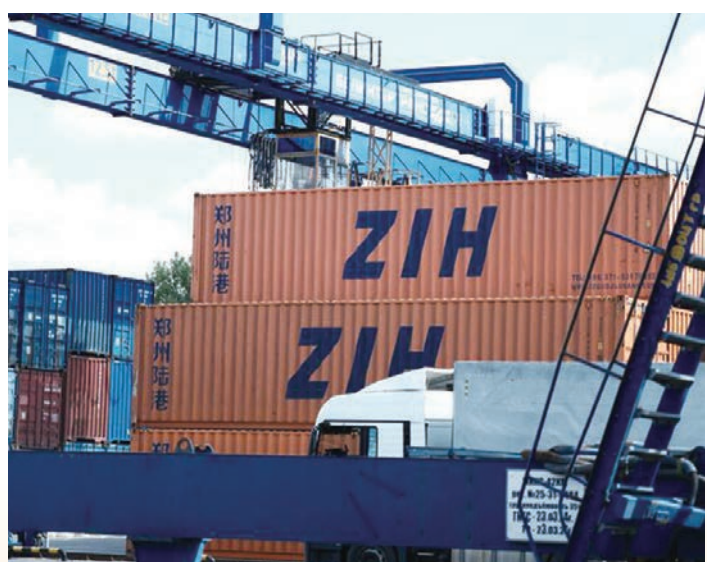
◆ 白俄羅斯科里亞季奇車站中的中國集裝箱。

史籍記載，中國和哈薩克斯坦有着數千年的友好交往史，共同譜寫了古絲綢之路貫通東西的壯美詩篇。