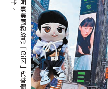
◆炎明熹美國粉絲帶「Gi囡」代替偶像打卡。

香港文匯報訊(記者 子棠)炎明熹(Gigi)的人氣高企,成為全港最年輕女歌手登上美國時代廣場巨幕。Gigi最近喜事一浪接一浪,繼宣布將於10月7日在Star Hall舉行《炎明熹Gi-FORCE