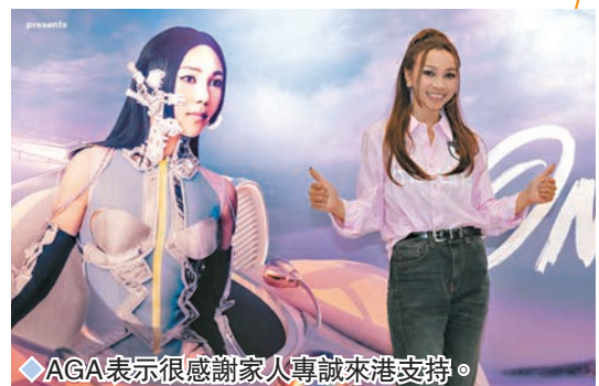
◆AGA表示很感謝家人專誠來港支持。

AGA騷後接受傳媒訪問時,表示很感謝家人專誠來港支持,還為她的演唱會很緊張;而完成演出後,最想要的是吃薯條:「我終於可以食喇,呢幾個月一直食健康餐單。」當AGA透露有巡迴演唱會的計劃時,被問到婚禮和巡迴哪樣先?她指尚未有婚期,會先辦巡迴及完成手頭上兩張專輯;並大讚未婚夫很好、很尊重她,明白她還有工作未完成,有共識在適當時候才辦婚禮。笑指帶同未婚夫巡迴可順道預演度蜜月,AGA坦言會考慮,因為家人都會同行。她又提到在籌備個演唱會期間,媽媽和婆婆都入了醫院令她很擔心,每天心情都起伏很大。問到未婚夫有否給予安慰?AGA說:「他在今次個唱中給予我很多鼓勵,還每日跟進我媽媽的情況,他幫助了我許多,而媽媽已經出院了。至於婆婆的狀況更算是奇跡,留院期間一度嚴重,令我們非常擔心,婆婆還一直做物理治療,最後能到場睇騷。」說到另一半是否100分的未婚夫?AGA甜笑點頭認同,而問到會否為紀念結婚而作首歌,她就怕醜地說「好肉麻」,但亦指有靈感都會作一曲。