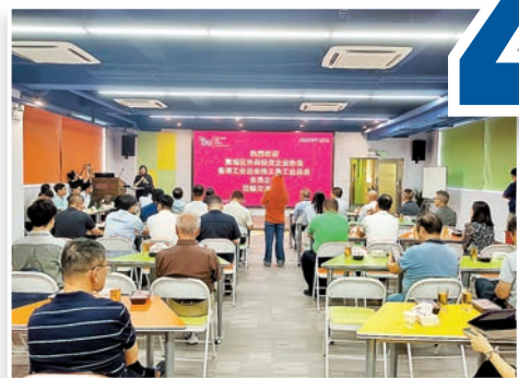
近日在惠州舉行的新型自動化成果分享論壇，吸引了近百家港企參加。