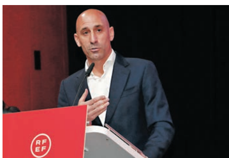
◆魯比亞里斯飽受下台壓力。資料圖片

另一件有趣的事，是BBC最近在報道魯比亞里斯的新聞時，中間錯誤夾雜了前曼城球員薩巴列達的片段。由於兩人長相相似，令到薩巴列達此番無辜中槍。