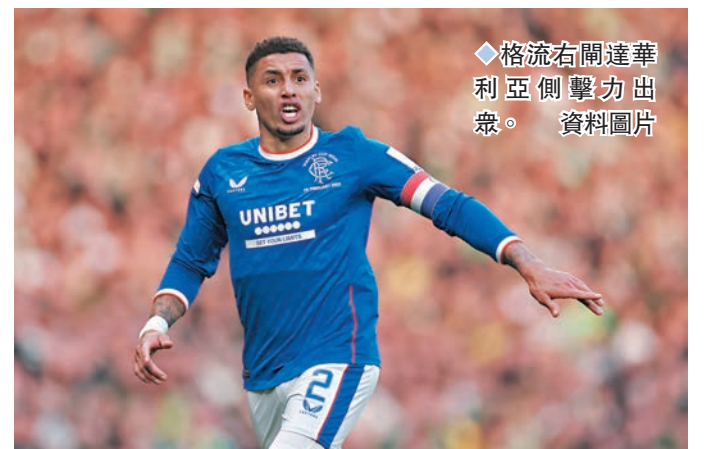
◆格流右開達華利亞側擊力出眾。資料圖片