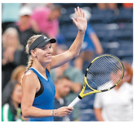
◆禾絲妮雅琪慶祝晉級。

禾絲妮雅琪曾是女網世界第一的好手，2020年打完澳洲公開賽後退出網壇，把重心放在家庭生活，並生下兩個孩子。她於這個月稍早時候重返網壇，並於昨天復出後的首場大滿貫賽中出戰世界排名第227的普索露娃，首盤破了對手三個發球局，後者因腿傷在比賽期間接受治療，最後不敵「禾琪」這位2009年和2014年美網亞軍得主。「禾琪」接下來將與曾在美網奪過金盃的妮維杜娃對壘。