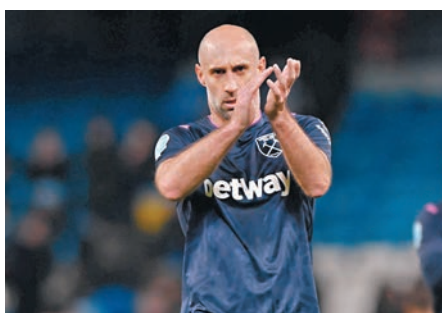
◆薩巴列達長得像魯比亞里斯。資料圖片