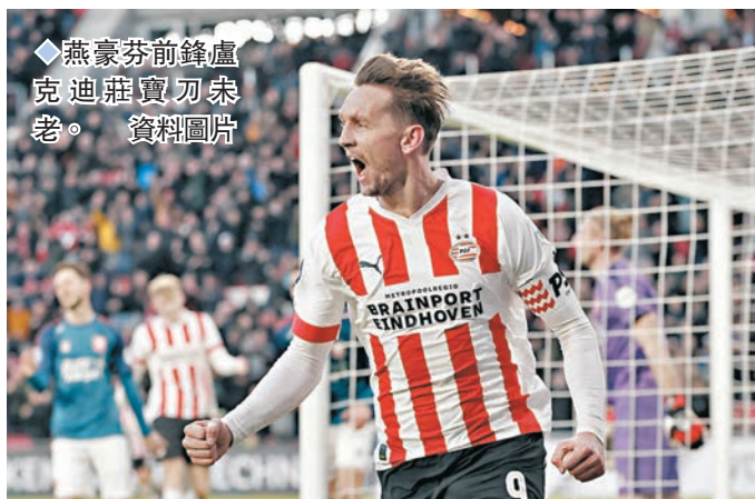
◆燕豪芬前鋒盧克迪莊寶刀未老。資料圖片