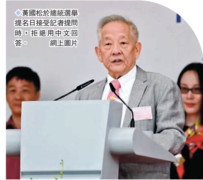
黃國松於總統選舉提名日接受記者提問時，拒絕用中文回答。

香港文匯報訊 新加坡6年一屆的總統大選今日舉行，由3名候選人角逐，不過在選前拉票期間，華裔候選人黃國松卻因拒絕用中文回答記者提問引起爭議，不少當地民衆尤其華裔選民不滿黃國松的做法，亦擔心他一旦當選，或難以展現新加坡的形象。黃國松事後解釋自己並非不願講中文，而是自幼時教育原因中文講得不好，希望日後自己能有重拾中文的機會。