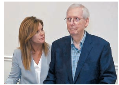
麥康奈爾突然僵住，助手連忙上前協助。

81歲的麥康奈爾自2007年起擔任參議院共和黨領袖，他於3月出席晚宴時跌倒，引致腦震盪及輕微肋骨骨裂，需休養6周，身體狀況引起關