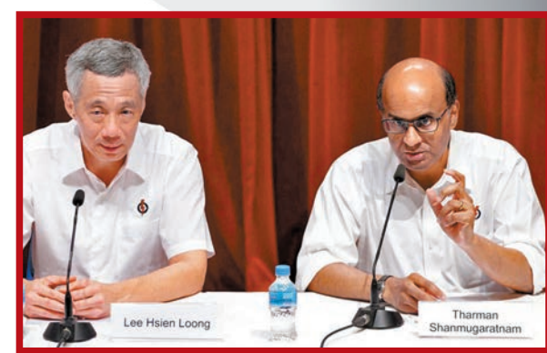
尚達曼(右)曾在執政人民行動黨政府擔任要職，旁為總理李顯龍。

香港文匯報訊 新加坡歷來已有數名非華裔總統，不過掌握實權的總理一職，至今只有華裔擔任過。新加坡會否出現非華裔總理，也成為今屆總統選舉熱議話題。曾在執政人民行動黨政府擔任要職的候選人尚達曼表示，他相信只要有能力合適的候選人，新加坡任何時候都準備好接受非華裔總理。