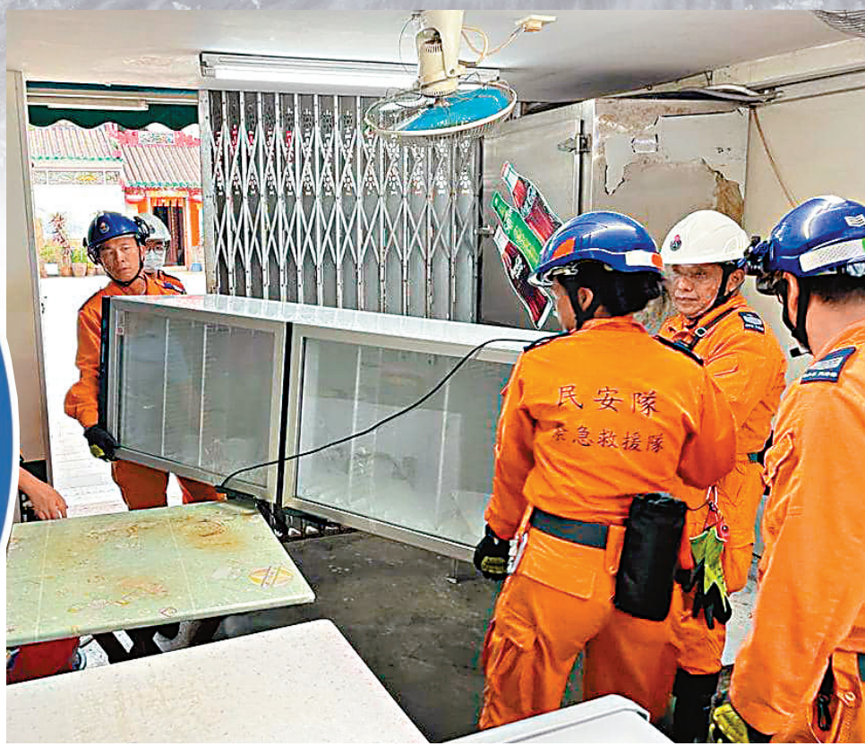
◆民安隊員協助大澳南戶移動雪櫃避免水浸。

曾在強颱風「天鴿」、「山竹」吹襲變成澤國的大嶼山大澳，今次再受「蘇拉」吹襲列為高危水浸，昨晨已見輕微水浸，預計今日清晨大澳水位會升至海圖基準面以上約3.5米，比正常潮位增加接近2米。香港特區政府離島民政事務處提早啓動大澳水浸預警系統，並在大澳鄉事委員會設立緊急事故協調中心，聯同消防處、警務處、社會福利署、其他有關政府部門及非政府機構，部署協調疏散、救援及緊急支援工作，安排住在大澳低窪地區的居民在水浸來臨前到安全地方暫避，並協助村內120至130多名長者撤離，另有10名行動不便長者已被送到庇護中心暫避。 ◆香港文匯報記者 蕭景源