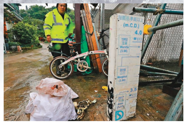
◆鯉魚門三家村標示了歷次風災的水浸高度。