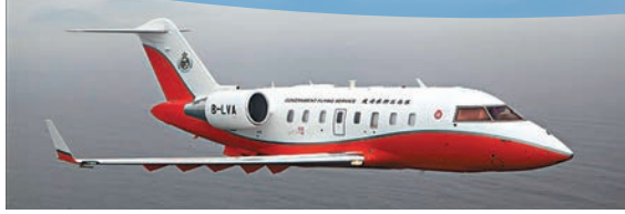
▲政府飛行服務隊的挑戰者605定翼機。