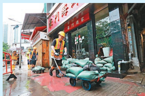
◆鯉魚門三家村大部分商舖昨日下午已嚴陣以待做好預防措施。

離島民政事務處已啓動設於大澳鄉事委員會的緊急事故協調中心，中心由民政處、消防處、警務處、社會福利署等政府部門及非政府機構成立，以協調疏散、救援及緊急支援的工作。分別設於大澳鄉事委員會、鄰舍輔導會東涌綜合服務中心和香港基督教女青年會大澳社區工作辦事處的臨時庇護中心，以及龍田臨時收容中心已開放予有需要的居民暫時使用。警務處、消防處、民安隊服務隊人員已全面戒備，協助受影響的居民到臨時庇護中心或其他安全的地方暫避。