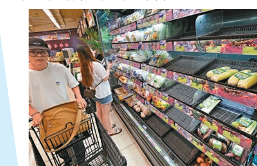
◆一間超市的菜架昨日已補充分蔬菜。

香港文匯報訊(記者 郭倩、吳健怡、文森) 在日間「蘇拉」風力未算太強，不少市民到街市及超市囤糧，有菜檔趁機提價數倍。香港文匯報記者昨日到超市和街市直擊，超市貨品在前一日被搶購後已補貨，有颶風來臨前「搶不到貨」的市民說：「幸好颶風還沒算強勁時備好糧！」部分街市僅有零星菜檔照常營業，有前往買菜的市民指菜價較平常貴很多，但逼於無奈只能捱貴菜。