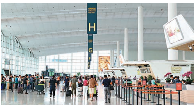
通過恢復及加密航線，白雲機場國際、國內旅客量快速上升。圖為廣州白雲機場。