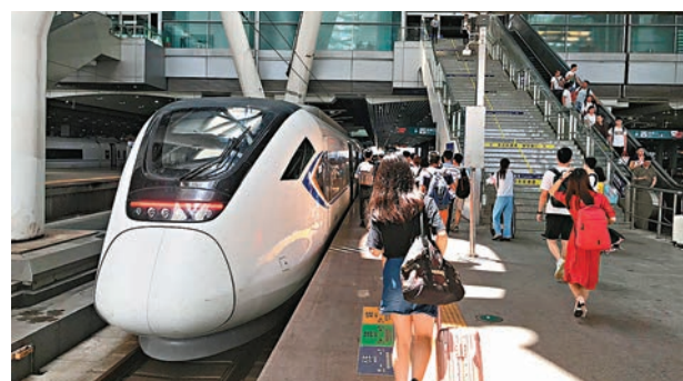
穗深港三大機場之間有望通過高鐵路實現互通。圖為人們乘高鐵路出行。