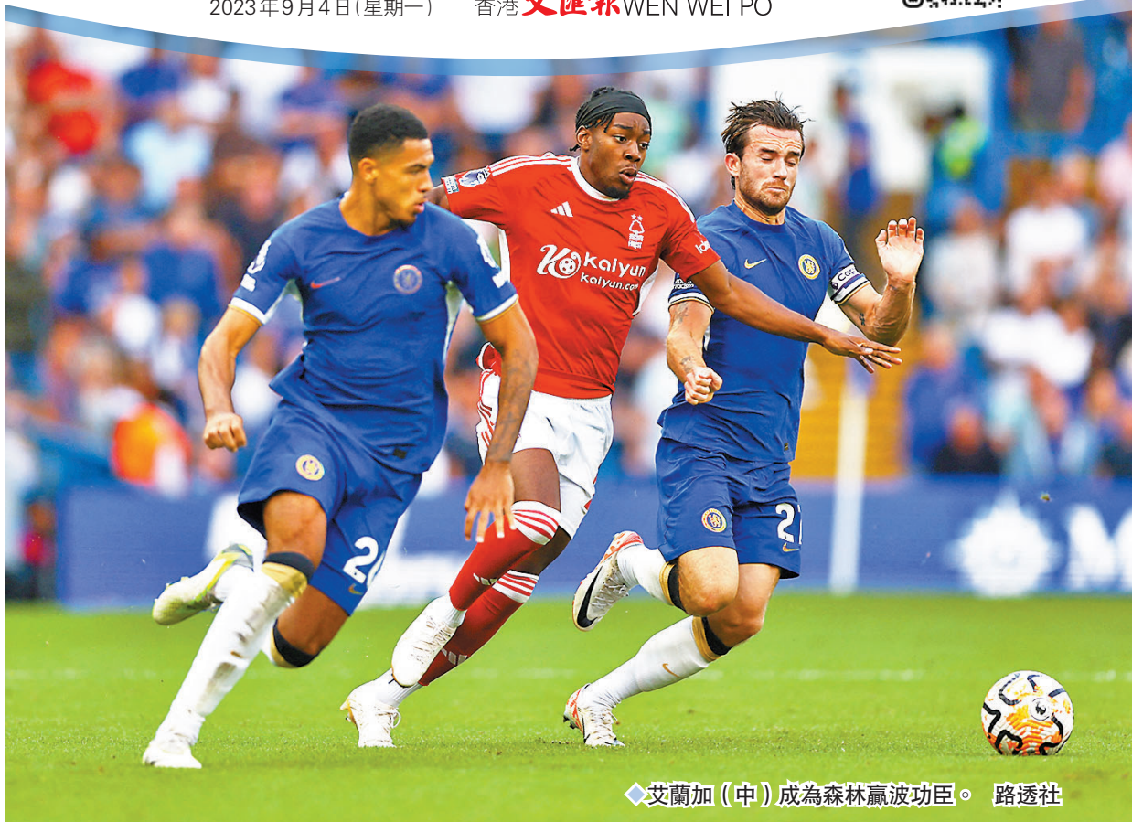
艾蘭加(中)成為森林贏波功臣。