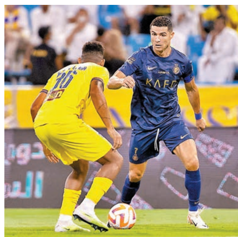
C朗(右)再創下新里程碑。

同日其他比賽，有馬列斯及法明奴等壓陣的吉達艾阿里，令人意外地作客以1：5慘負艾法特。至於希拉爾則憑新援米杜域個人連中三元，作客以4：3險勝有賓施馬取得一個入球的伊蒂哈德。