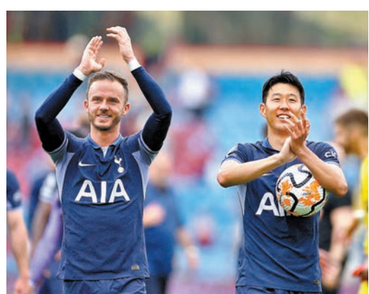
孫興民(右)個人連中三元。

同時間另一場比賽，曼城在艾寧夏蘭特亦連中三元下，主場以5：1輕取富威，聯賽4戰全勝，亦是英超唯一能全數贏波的球隊。