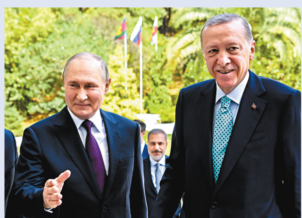
普京(左)與埃爾多安在索契舉行會談。

普京對此表示，俄方對糧食協議談判持開放態度，但在西方達到俄方要求前，不會有任何新協議。他還稱，希望近期雙方結束在土耳其建立天然氣樞紐的談判工作，以便保證能源局勢更穩定。