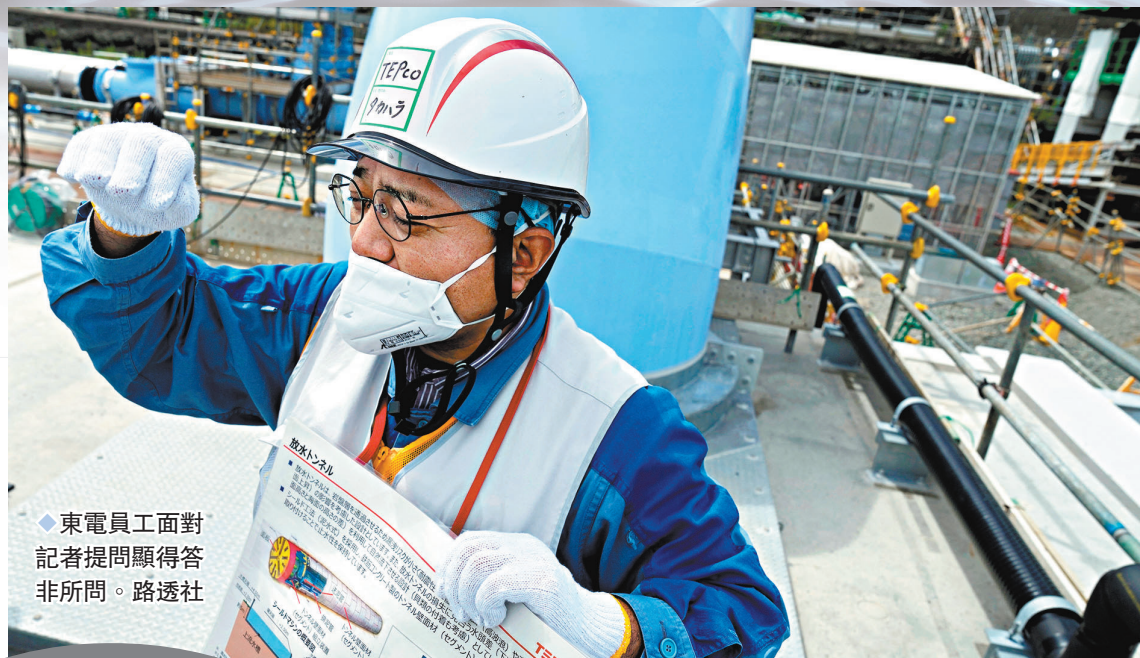
東電員工面對記者提問顯得答非所問。

報稱，當記者走近稀釋設備旁邊的管道時，聽到了水流聲，往前30米處有藍色大管道，儘管無法繼續靠近，但管道中強勁的水流發出了「隆隆」的聲響，甚至震動起來。