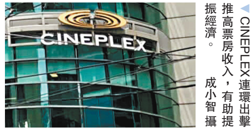
CINEPLEX連環出擊 提高票房收入，有助提振經濟。