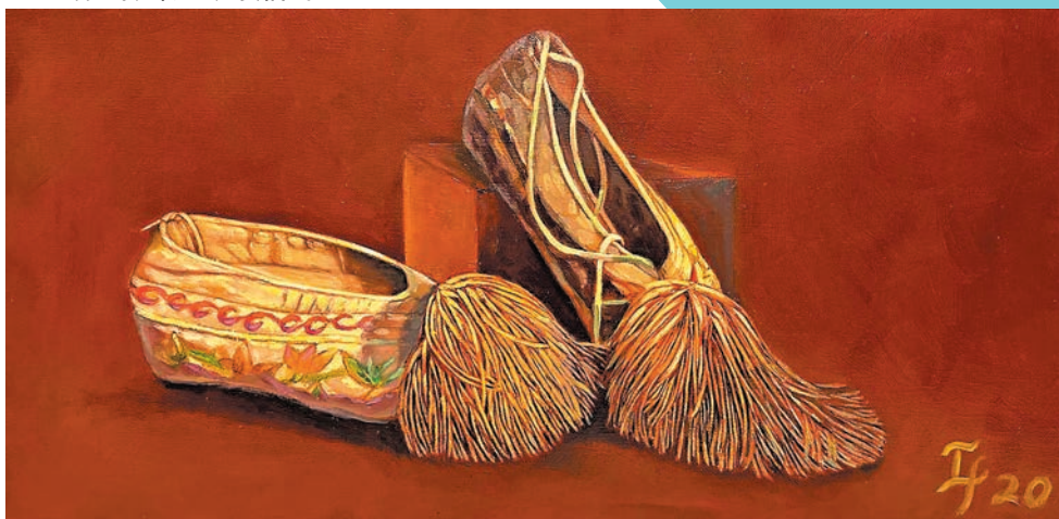
◆粵劇紅伶鄧美玲的繡花鞋