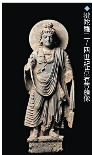
◆鍍陀羅三/四世紀片岩菩薩像

其他展品包括一件藏中十五世紀銅鎏金寶帳大黑天像，此尊二臂形象的大黑天雄壯有力，手持骷髏「嘎巴拉」碗及鉞刀，腳踏魔障，氣勢駭人；其頭髮、眼眉與鬚鬚皆著紅色顏料，有如熊熊怒火。大黑天此一威武形象於元代 (1290-1368年) 頗為流行，被視為戰神與護國神祇。此種尊崇其後延續至明代，永樂一朝尤盛。另一件西藏十九世紀堆繡藥師佛唐卡，是藏匠將華麗布料精心裁剪