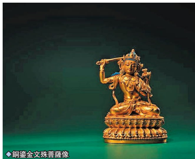
◆銅鎏金文殊菩薩像

並拼接而成的唐卡，創造出如繪畫般生動而富麗的畫面，技藝超凡。此幅唐卡中央為藥師佛，其體態如青金石，莊嚴奪目，手上托鉢盛滿妙藥甘露，解救一切病苦。身心健康，正是佛教修行之先決條件。另一件鍍陀羅三/四世紀片岩菩薩像亦值得