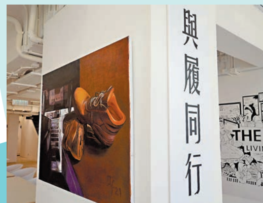
◆展覽的畫作記錄了各行各業人士的鞋子。

展覽：「與履同行」 展期：即日起至9月17日 時間：10:00-18:00 地點：深水埗鴨寮街82及84號地下 The Bridge+ Living Art Space