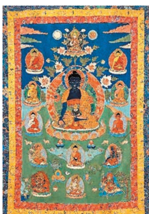
◆西藏十九世紀堆繡藥師佛唐卡