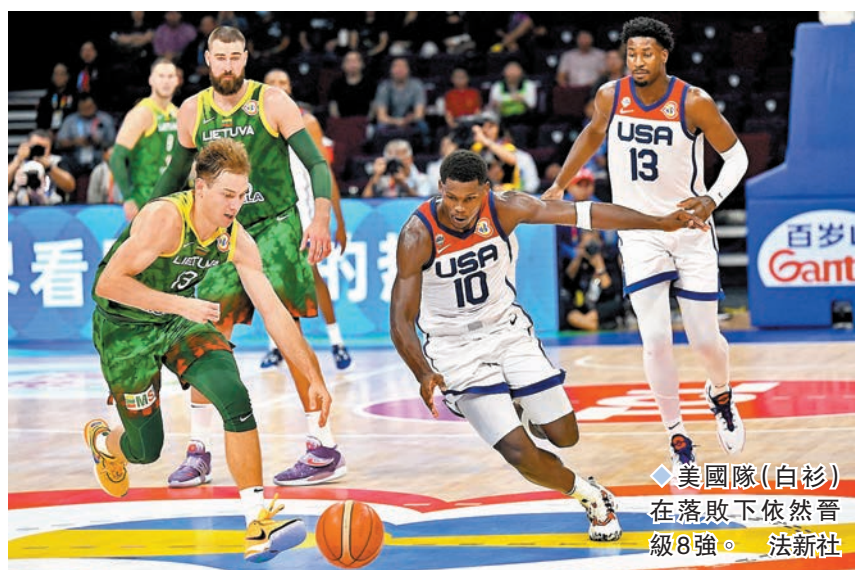
美國隊(白衫)在落敗下依然晉級8強。

更讓人大跌眼鏡的是，衛冕冠軍西班牙隊在16強複賽中遭遇兩連敗，止步16強。其中在複賽首輪比賽中，西班牙隊以69:74不敵世界盃新軍拉脫維亞隊，爆出本屆世界盃的最大冷門。