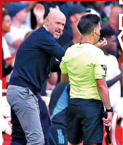
◆坦哈格(左)對球證表現十分不滿。