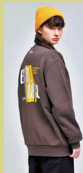
◆135周年紀念系列時尚服裝

個性魅力。除服飾之外，行李箱亦是旅途中不可或缺的時尚單品，全新概念店搶先推出最新別注版行李箱及秋季新款服飾，多款實用配件陪你走上一趟時尚與功能性兼備的旅程。為了迎接秋季來臨，品牌也推出多款秋季新款潮流服飾，包括今季大熱的拼色風格防風外套，當中採用以防水透氣見稱的GORE-TEX物料，功能與舒適兼備，展現獨特率性的品味，是今季潮流造型首選；簡約休閒的東腳長褲採用貼心的修腳設計，搭配彈性布料，不僅突顯腿部修長線條，亦增添舒適感，造就Urban Outdoor造型。