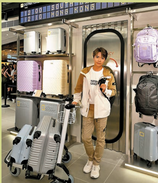
◆張敬軒時尚演繹 National Geographic 秋季服飾及別注版型格旅行箱

踏入九月，雖然剛剛還颳起颶風，但其實天氣已慢慢走入秋天了，在這個初秋，不少戶外品牌已相繼推出秋季時尚服飾、配袋及鞋履，有的展現出街頭風格，搭配舒適自在的剪裁，盡顯個性魅力；有的用色百搭，流線型設計襯托出休閒穿搭或運動造型，配合用家的不同日常需要，令到每一步都保持舒適靈活。還有，具備撥水功能的多功能摺疊隨身包，讓你在戶外探索時可無懼任何天氣，輕鬆到大自然外遊。