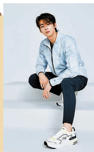
◆車銀優穿上Max Cushioning Hyper Burst輕量中底高回彈力跑鞋

系列應用Max Cushioning舒適科技設計，採用Ortholite專業抗菌科技鞋墊及具有高回彈性能的Air-Cooled Goga Mat透氣鞋墊，提供額外的舒適度和氣流，保持足部涼爽。同時，系列亦加入美國知名輪胎品牌Goodyear的橡膠製作高性能大底，提供更強的抓地力、穩定性和耐用性，讓每位運動愛好者在進行任何運動時都感到放心，無顧慮地發揮最佳狀態，突破自己。而且，其多元化的性能亦適合用家在日常走路或慢跑時穿着，避震緩衝、高回彈力抓力及透氣設計，保持舒適靈活，輕鬆踏出每一步。加上，系列的用色百搭，流線型設計襯托出休閒穿搭或運動造型，配合用家的不同日常需要。