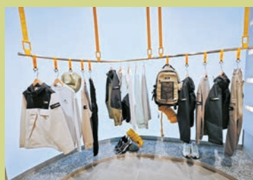
◆秋季新款潮流服飾

同時，概念店率先帶來135周年紀念系列時尚服裝，糅合135周年概念印花及品牌標誌性的黃色設計元素，為簡約單品注入潮流時尚感。面料使用可自然分解的有機棉，減少對海洋及土壤的污染，亦提供柔軟舒適的穿着感，傳承品牌與大自然和諧共存的理念。例如，135周年紀念印