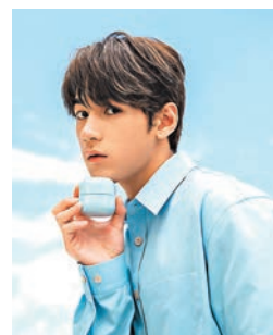
◆水庫補濕微質酸補濕乳霜

LANEIGE皇牌No.1爆水面霜，透過獨特的配方科技，升級比一般透明質酸小的2,000倍激透透明質酸，能秒速滲透直達10層肌底，激活肌膚細胞，補濕、鎖水、修復一步到位。其備有100小時長效補濕鎖水，使用後肌膚水分即時增加196%；100小時後仍可高鎖水至56.5%，任何時刻都為肌膚細胞提供最強補濕支援。同時，使用1小時肌膚屏障受損修復效能達62.2%。舒緩因外在環境因素而引發的皮膚問題，有效改善敏感泛紅達92%、減少乾癢脫皮68.2%，急救肌膚問題，使肌膚重回水潤淨透嫩滑。