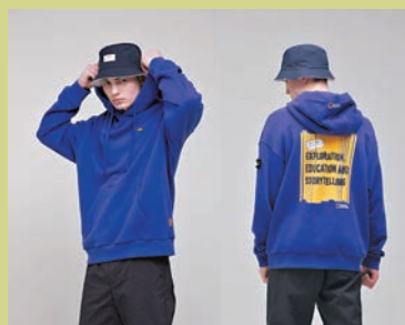
◆135周年紀念系列時尚服裝

花長袖T恤，背後採用品牌周年紀念圖案點綴，以「Curiosity」、「Wonder」等字樣表達了品牌秉持探索世界的無限好奇心，休閒的半寬鬆剪裁帶出隨性風，成為入秋百搭時尚單品。