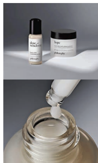
◆彈透美肌煥活精華

早前，philosophy全新的dose of wisdom bouncy skin re-activating facial serum以滿載活氣的專利肌膚活力提升複合技術，激活肌膚活力，煥發彈力，飽滿而明亮新肌。只需一星期，重現肌膚十大健康指標：肌膚再生、飽滿、減淡細紋、剔透、細嫩、水潤、明亮、嫩滑、柔潤及強韌，綻放彈透柔亮健康美肌。其首度研發滿載活氣的專利肌膚活力提升複合技術，融合品牌獨有的dermatologic wisdom肌膚智慧理念，導入經分子接枝的維他命c及透明質酸，讓護膚成分功效加倍顯著功效，同時將刺激性減到最低，任何膚質(包括敏感肌)都可放心使用，令肌膚散發彈嫩、飽滿、水潤的健康神采。