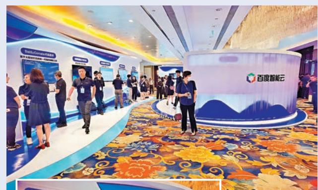
◆場上展示百度智能雲系列全產品。