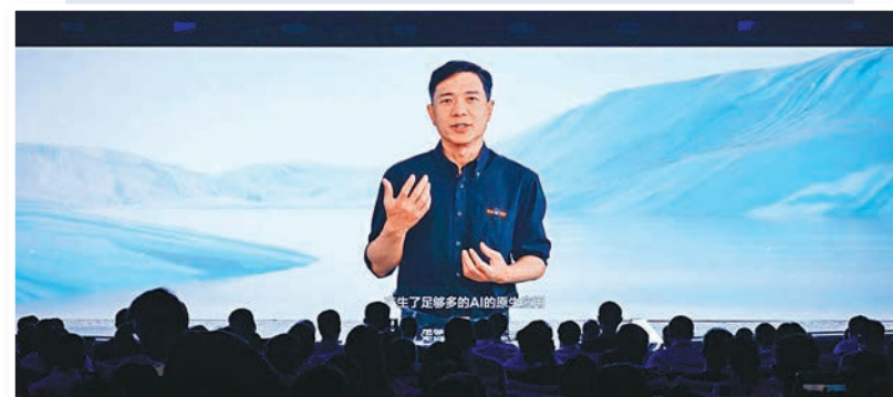
◆百度創始人、董事長兼首席執行官李彥宏在視頻發言，指百度不久後將推出文心大模型4.0版本。

上週四，包括百度、商湯在內的中國人工智能（AI）大模型研發企業宣布將旗下AI大語言模型產品面向社會公眾開放。