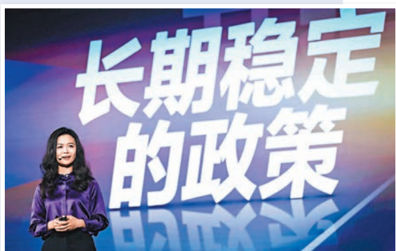
▶袁佛玉透視，下一階段將面向四類夥伴發布大模型生態夥伴計劃。