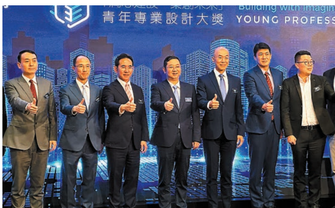
◆中聯辦青年工作部副部長、一級巡視員宋來(左四)為活動致辭時表示，這次大賽邀請香港青年專業人才展示對城市居住環境的設計共想，是青年人展示創造力、相互交流、相互學習的理想平台。

中聯辦青年工作部副部長、一級巡視員宋來為活動致辭時表示，這次大賽邀請香港青年專業人才展示對城市居住環境的設計共想，是青年人展示創造力、相互交流、相互學習的理想平台。「北都會區」是此次大賽重點關注的設計規劃區域。這個區域以國際創新創科新城為主題，集優質生活、產業發展和文化休閒一體，打造宜居、宜業、宜遊的空間，未來可容納250萬人居，提供65萬個職位，其中包括15萬個創科產業的相關職位，充滿了機遇和無限可能，是驅動香港再創高峰的新引擎，也是香港青年揮灑汗水、實踐夢想的絕佳舞台。 「青年是標誌時代最靈敏的晴雨表，時代的責任賦予青年，時代的光榮屬於青年」。去年七一的時候，習近平總書記視察香港，並且發表了重要講話，特別指出要幫助廣大青年解決學業、就業、創業、置業面臨的實際困難，為他們的成長成才創造更多的機會。近年來，華潤置地積極地回應中央的號召，在青年人才培養、青年實習培訓就業、青年學習交流等多個方面，務實功、求實效開展的系列活動取得