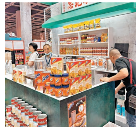
◆香港餐飲展2023昨日起一連三日假香港會議展覽中心舉行。

另外，展覽將一連三日舉行多個酒類飲品頒獎禮，以表揚全球葡萄酒及烈酒生產商、貿易商和從業者的貢獻和傑出表現，最佳烈酒大獎旨在評選出各範疇的頂級烈酒，並表彰提供高質烈酒的酒吧、餐廳和酒店，香港和酒大賞則旨在為香港進口商、分銷商及日本直達的清酒、葡萄酒、水果利口酒和烈酒中選出各類型最佳釀釀；而 Wine Luxe 國際大獎將評選出頂級佳釀，藉此增強中國消費者購買及飲用葡萄酒的信心。