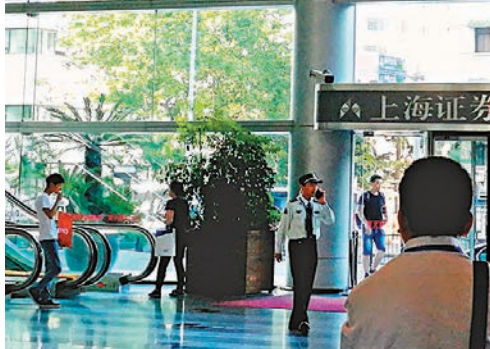
◆滬指昨日收報3,154點，跌0.71%。

香港文匯報訊（記者孔愛瓊上海報道）經過周一的大漲之後，滬深A股昨天出現獲利回吐。三大股指集體低開，午後延續早盤低迷格局。盤面上房地產、金融、傳媒等跌幅靠前，順周期方向全線回調。截至收盤，上證綜指跌0.71%，報3,154點；深證成指跌0.67%，報10,540點；創業板指跌0.32%，報2,111點。兩市成交總額8,039億元（人民幣，下同），北向資金淨賣出46億元。