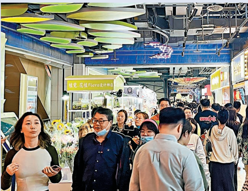
◆有機構分析指，內地製造業活動的下行壓力已經在退散，建築活動在加速，這些都抵消了服務業進一步趨弱的影響，如果政策支持力度繼續加大，可能出現溫和的周期性復甦。

此前公布的8月財新中國製造業PMI上升1.8個百分點至51，為6個月高位，部分抵消了服務業PMI回落的拖累，製造業和服務業一升一降之下，8月財新中國綜合PMI微降0.2個百分點至51.7，為2月以來最低。