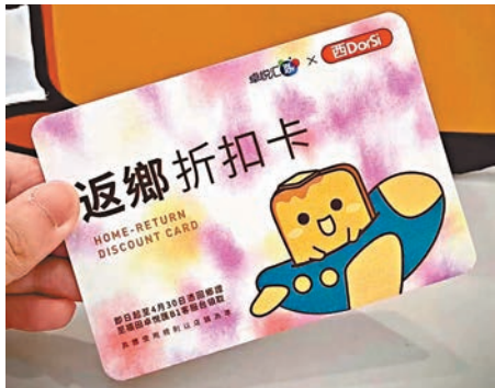
◆西DorSi與商場聯合推出的港人優惠卡。

西DorSi說，儘管是免費推廣，但是可以預期雙贏的效果：「對於商場、商家及我自己來說，已經達到雙贏的效果。僅僅換一個形式，他們用原本有的優惠吸引到港人消費者，而我也通過這樣的合作，讓更多粉絲相信我認我、喜歡我。」西DorSi也坦言，自己亦會接部分有償合作項目，以商場體驗為主：「我給自己定下的原則是不接餐廳的有償合作推廣，因為我無法肯定，我自己吃到的和粉絲吃到的，品控標準是否一致。」