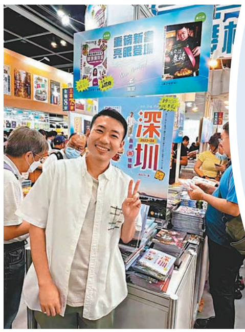
◆近期，西DorSi出版了自己的旅行攻略書。香港文匯報深圳傳真

◆六年前，西DorSi因一條介紹深圳海底撈服務的視頻一炮而紅。香港文匯報深圳傳真