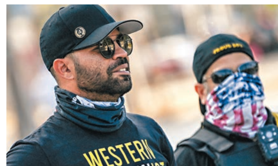
塔里奧(左)形容衝擊國會事件令美國尷尬。資料圖片

自己並非政治狂熱分子，造成傷害或改變選舉結果從來不是其目標。不過法官指塔里奧直到判刑當天為止，都未曾就自己犯下的罪行公開表達悔意。法官表明煽動陰謀是嚴重罪行，塔里奧與庸置疑是整場陰謀的首腦，又指衝擊國會事件損害美國多年來和平移交權力的傳統，認為需要作出嚴厲懲罰，以阻止政治暴力再次發生。