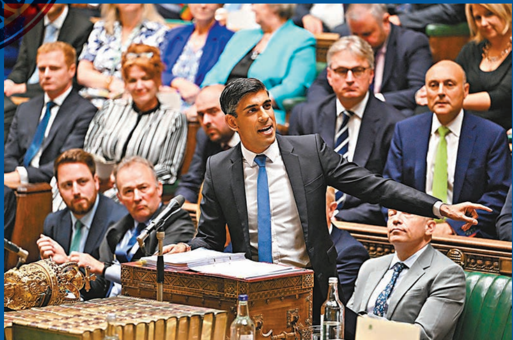
蘇納克年初許下的五大承諾之一，是2023年底將通脹率降低一半。