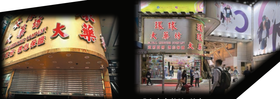
◆「安康大藥坊」職員稱什麼都不知道。