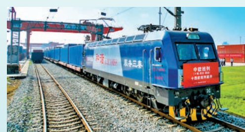
◆中歐班列「長安號」令企業物流效率大大提高。

公開數據顯示，吉爾吉斯斯坦全國人口逾700萬，中國已成為吉爾吉斯斯坦第一大貿易夥伴國和投資來源國。2022年，雙邊貿易額達155億美元，創歷史新高。