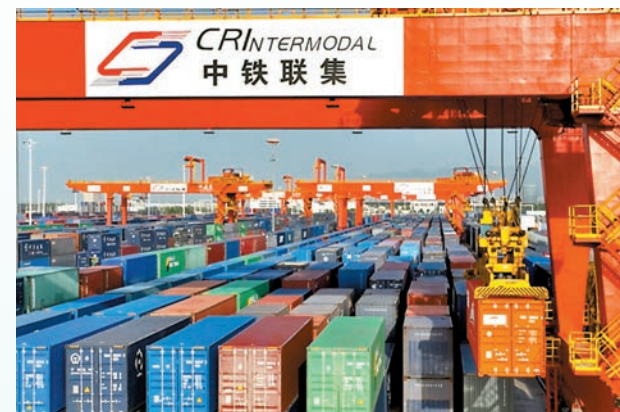
◆「一帶一路」倡議下，中吉兩國貿易及文化交流越見頻繁。