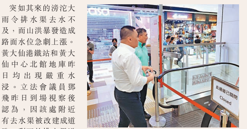
◆鄧飛視察黃大仙中心北館的水浸情況。

突如其來的滂沱大雨令排水渠去水不及，而山洪暴發造成路面水位急劇上漲。黃大仙港鐵站和黃大仙中心北館地庫昨日均出現嚴重水浸。立法會議員鄧飛昨日到場視察後認為，因該處附近有去水渠被改建成道路，剩下的排水渠道難以應付是次傾盆大雨，令大量從獅子山急瀉下來的洪水湧入黃大仙祠外的低窪處，再灌入黃大仙港鐵站和黃大仙中心底層。