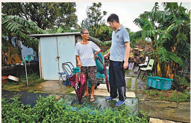
◆何俊賢走訪漁農戶了解其受災損失。

黑色暴雨之下，本地漁農業損失慘重。來自漁農界的民建聯立法會議員何俊賢昨日走訪新界多個鄉郊地區的農場及養魚塘，了解業界的受災情況。