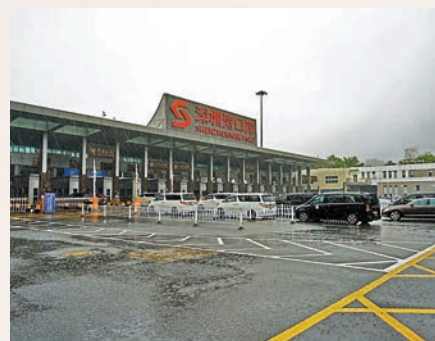
◆8日部分深港跨境車轉行深圳灣口岸。深圳文匯報深圳傳真。