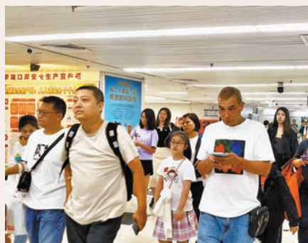
◆8日羅湖口岸入境客流。

據介紹，去年，羅湖口岸增加了一個強排水泵，此次發揮了重要作用。通過排水和沙包圍堵，積水並未進入到大廳。