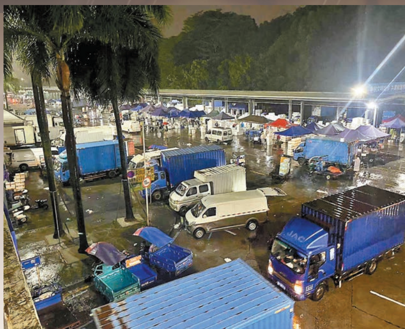
◆深圳海吉星農批市場地勢比較高，排水設施維護很好，市場正常運轉。香港文匯報深圳傳真。

深 圳市口岸辦8日凌晨5點便發布公告稱，深圳蓮塘口岸、文錦渡口岸地下設備間水浸，部分設施設備受損，兩個口岸暫停服務，供港鮮活食品車輛轉行皇崗口岸，其他貨車可轉行深圳灣口岸。據多位貨櫃車司機描述，8日，香港前往深圳的路上，一些車因積水熄火影響了通行，導致塞車，較平時多花幾倍的時間方到達深圳海吉星農批市場拉菜。