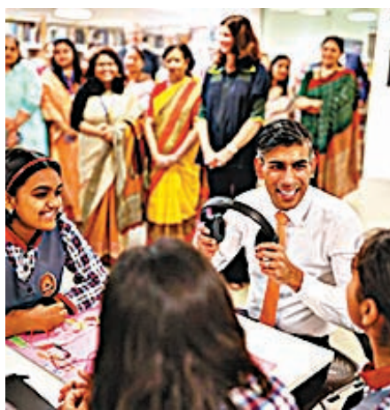
◆蘇納克與印度學生會面，相談甚歡。

另一方面，印度耗資近1.2億美元（約9.4億港元）美化峰會舉行地點新德里，包括翻新建築及行人路，在會場附近增設花卉、噴泉及壁畫等，並清拆附近貧民窟，有團體指近30萬名居民被迫遷離，惹來人權組織批評。