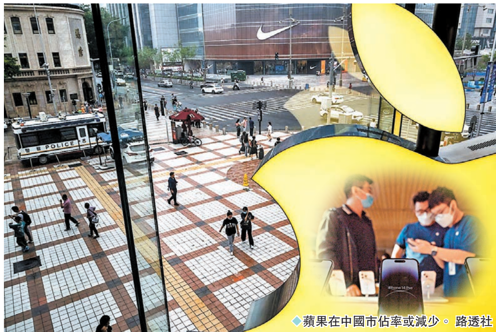
◆蘋果在中國市佔率或減少。

與此同時，中國電訊設備生產商華為發布最新旗艦手機Mate 60 Pro，大受用家歡迎，勢打擊蘋果手機在中國市場的份額。據《金融時報》報道，自美國於2019年開始對華為實施制裁，華為在中國的智能手機市場份額從2020年中的29%，下降至2022年中的7%。天風國際分析師郭明錤估計，到2023年底，華為最新型號手機的出貨量或高達600萬部，全年出貨量按年增約65%，增至3,800萬部。展望2024年，華為手機出貨量可望至少達到6,000萬部，為全