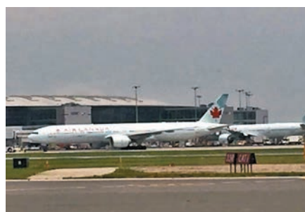
◆加國航空公司普遍人手短缺，加重營運負擔。

全國規模最大的加航承認與機師談判續約存在着困難，而資方現正與一批在9月29日約滿的機師討價還價。加航表示整個行業普遍缺乏區域機師，為了減輕資源壓力，該公司將於10月底停止從卡爾加里出發的6班直飛航班。西捷為了挽留資深機師大幅加薪，宣布機師工資在未來4年內提高24%，包括今年時薪上升15.5%。航空業顧問埃里克森指出，西捷與機師達成的新合約為加國民航業員工薪酬訂立新標準。