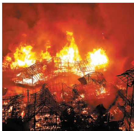
◆火災現場火勢猛烈，商舖變成火海。

芭堤雅水上市場是網紅打卡點，分為4個區域，分別模擬了泰國北部、中部、東北部、南部4個地區人們的生活方式。水上市場內有很多服務項目，出售泰國各種特產、工藝品。自2008年開業以來，該水上市場吸引眾多外國遊客前來打卡消費。