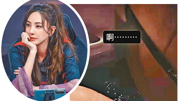
鄭希怡前晚在黑雨期間駕駛。資料圖片

香港文匯報訊(記者子棠)容祖兒和蔡卓妍(阿Sa)前晚相約欣賞鍾欣潼(阿嬌)主演的新片《女子監獄》，怎料散場之際遇上暴雨，祖兒義氣十足地做司機送二人回家，不過由於雨勢強勁阻礙視線之餘，沿路嚴重水浸，三人都嚇得花容失色；祖兒在駕駛時緊張地問旁邊的阿Sa：「我有冇行錯路？好驚訝，有冇橡皮艇？」阿Sa表示方向正確，着她可以繼續前行，但也禁不住連聲驚呼：「好恐怖、好恐怖！」而座駕經過的兩旁亦明顯翻起不少「海浪」。祖兒回到家後仍心驚地在社交網寫下：「好驚我架車死火，到處都變成河流，路面有唔同嘅大型垃圾，啱啱仲見到個石油氣罐嘍，完全看不清楚道路，大家真的要小心回家。」還Hashtag一句「嚇死我了」！阿Sa亦認同留言說：「真係有啲驚驚……」又指祖兒搵車變搵船，好彩祖兒食過夜粥，大家都安全返到屋企。