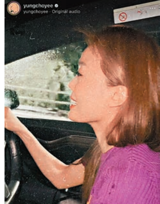
祖兒在黑雨下駕駛表現緊張。