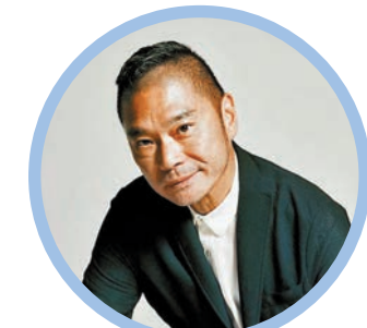
鄧達智前晚在香港電台做完節目《講東講西》後遇上黑雨。