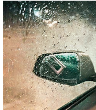
祖兒座駕經過時，兩旁翻起不少「海浪」。