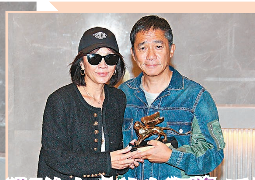
◆梁朝偉與太太劉嘉玲昨日飛抵香港。