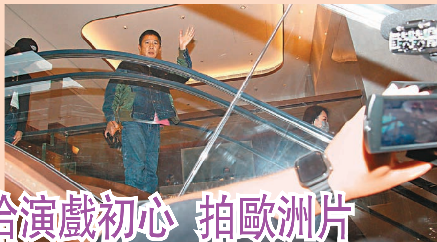
◆梁朝偉心情靚靚地向傳媒揮手打招呼。