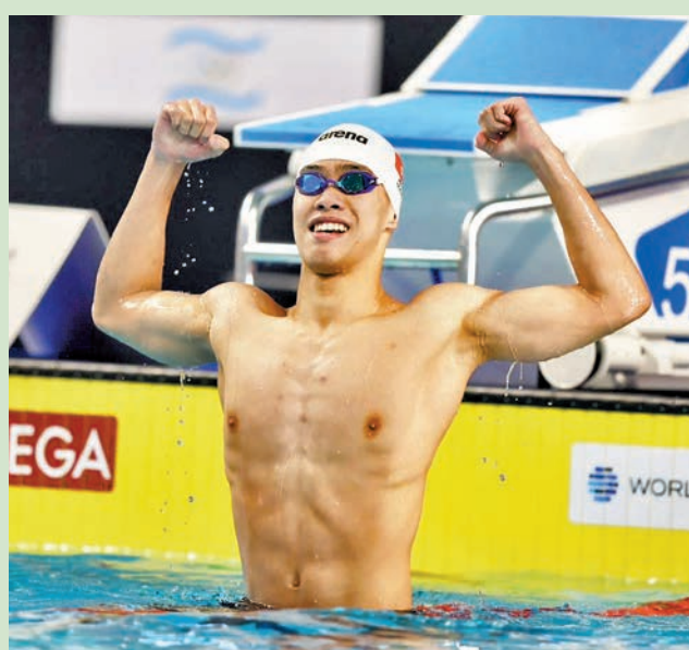
◆麥世靈衝線後激情慶祝。

兩位美國選手沙克利和海斯分別獲得女子50米蝶泳和200米混合泳冠軍，海斯還以2分10秒24的成績打破賽會紀錄。