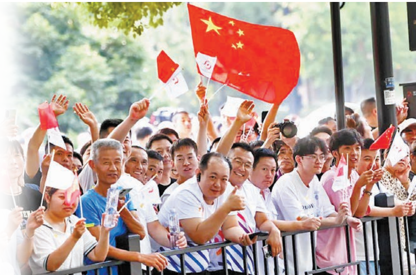
▲沿途擠滿了搖旗吶喊的熱情觀眾。

杭州站的火炬傳遞共有106名火炬手參與。傳遞路線主要圍繞着世界文化遺產杭州西湖，從涌金公園廣場出發，沿南山路—湖濱路—環城西路—北山街—西泠橋—孤山路進行，最後來到西湖十景之一的平湖秋月，傳遞線路全長5.2公里。