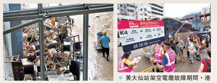
◆黃大仙中心北館仍有大量垃圾未清理。鐵安安排免費接駁巴士接載受影響乘客。