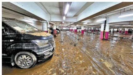
◆柴灣環翠邨停車場內的車被水泡過後，遭泥土和垃圾覆蓋。

香港文匯報訊（記者 蕭景源）在黑雨中受災嚴重的港島東區，昨日仍有不少地方滿目瘡痍。柴灣環翠邨商場和停車場積水已退，場內數十輛車被水泡過後，遭泥土和垃圾覆蓋，車主損失慘重。筲箕灣耀東道山泥傾瀉昨日仍未清理，但耀東邨昨日下午已回復食水供應。