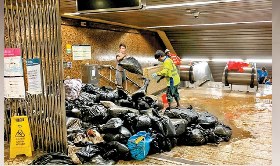
◆清潔工和港鐵人員在污水與泥濘中通宵清潔和搶修。