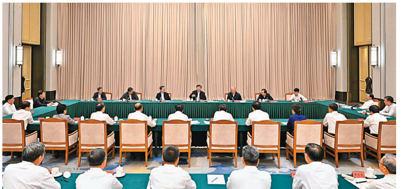
▲9月7日下午，中共中央總書記、國家主席、中央軍委主席習近平在黑龍江省哈爾濱市主持召開新時代推動東北全面振興座談會並發表重要講話。

香港文匯報訊 據新華社報道，中共中央總書記、國家主席、中央軍委主席習近平7日下午在黑龍江省哈爾濱市主持召開新時代推動東北全面振興座談會並發表重要講話。習近平強調，推動東北全面振興，根基在實體經濟，關鍵在科技創新，方向是產業升級。