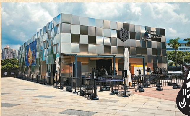
◆《一夢華胥|中國皮影沉浸式光影展》在深圳南山區歡樂海岸創展廣場舉行。