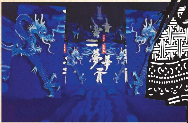
◆《一夢華胥|中國皮影沉浸式光影展》由這幕開始。

「一夢華胥」的典故出自春秋戰國《列子·黃帝》，講述了黃帝夢遊華胥國，而後天下大治的傳說；而「華胥氏」是中國上古神話中伏羲和女媧的母親，被視作中華文明的本源和母體。引用「一夢華胥」作為光廷首個中國主題系列展的展名，寄託了創作團隊對華夏五千年文明的景仰與眷戀之情。中國皮影是《一夢華胥》系列展的首個主題，拉開了中國民間非遺藝術登上世界級光影藝術舞台的序幕。未來《一夢華胥》系列展覽也將跟隨光廷走出國門，為世界觀眾獻上更多中華民族美學盛宴。