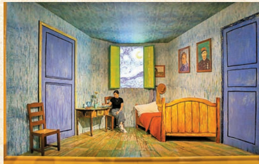
◆參觀者在「梵高再現」光影展上拍照留念。