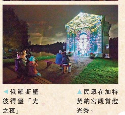
◆俄羅斯聖彼得堡「光之夜」