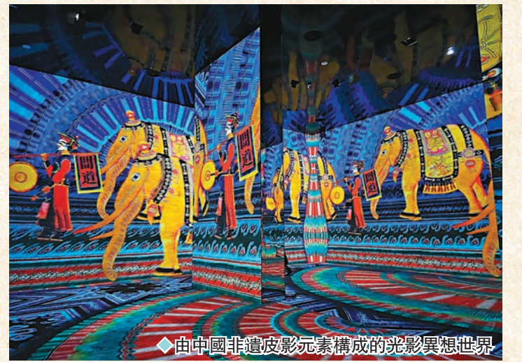
◆由中國非遺皮影元素構成的光影異想世界