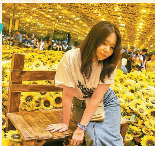
◆參觀者在向日葵鏡廊拍照留念。