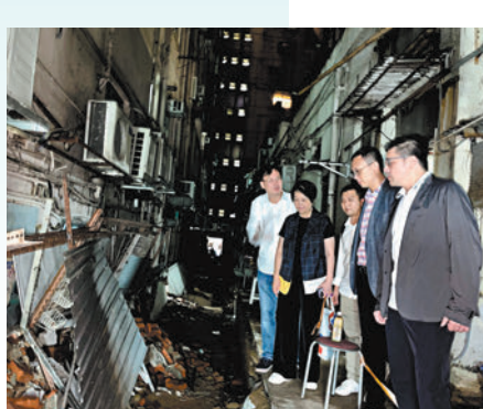
◆ 港島聯北綳地委會跟進多幢舊樓塌簷篷、爆屎渠。