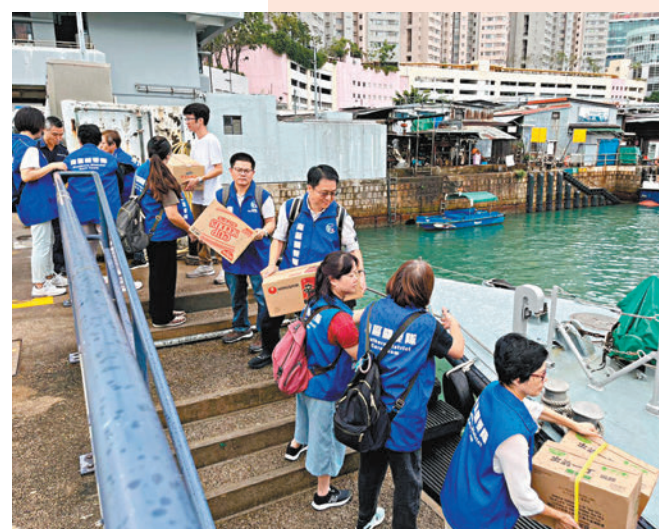
◆ 南區各關愛隊抽調人手迅速組建石澳救援小隊。