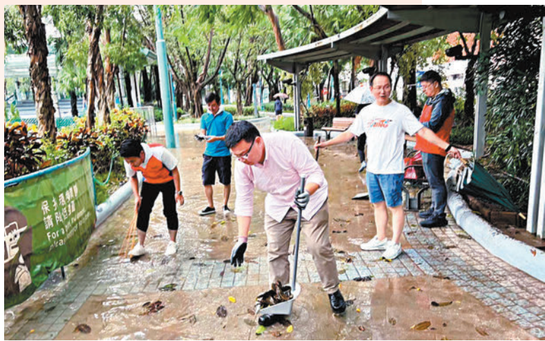
◆ 堅尼地城卑路乍灣公園渠淤塞導致嚴重水浸等災情。