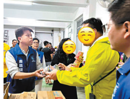
◆ 南區關愛隊為石澳居民送上應急物資。