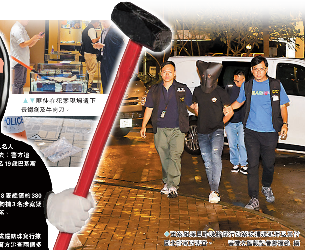
◆重案組探員昨晚將錶行劫案被捕疑犯押返其竹園北邨寓所搜查。