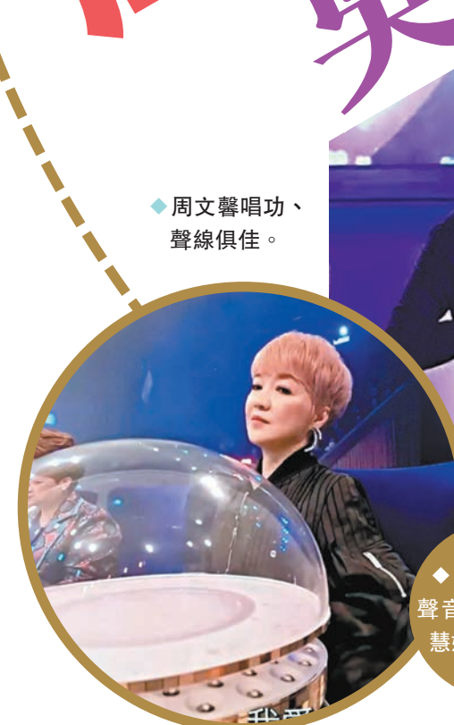
◆周文馨唱功、聲線俱佳。