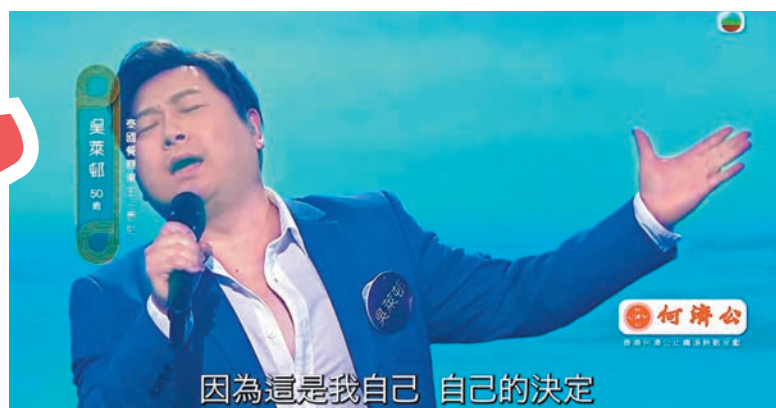
◆吳萊邨聲音獲讚有穿透力。