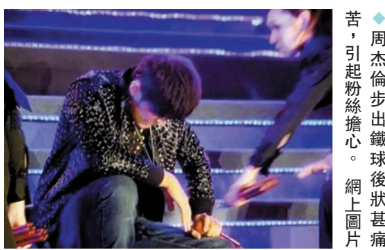
◆周杰倫步出鐵球後狀甚痛苦，引起粉絲擔心。