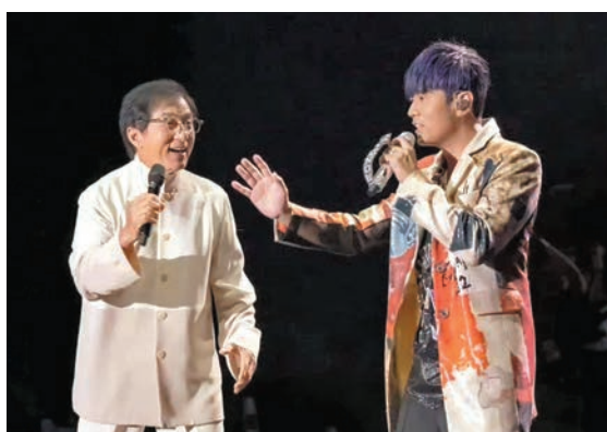
◆成龍與周杰倫台上互動展現好默契。

天津演唱會第三場迎來重量級嘉賓成龍。演唱會進行到一半，唱到《千里之外》時，成龍突然從一旁的舞台緩緩升起，跟着唱「我送你離開千里之外，你無聲黑白……」驚喜現身，影壇巨星和樂壇天王的世紀同台，讓全場4萬歌迷尖叫聲不斷。成龍大哥直呼：「歌迷的尖叫聲太震撼了！」周杰倫說：「大哥要不要再感受一下？」隨即喊起：「快使用雙截棍！」接着將麥克風朝向歌迷，全場高喊：「哼哼哈兮！」成龍也說：「下次我來打醉拳，呼呼哈兮！」讓全場4萬多名觀眾激動萬分，二人更合唱《千里之外》及《聽媽媽的話》兩首名曲。