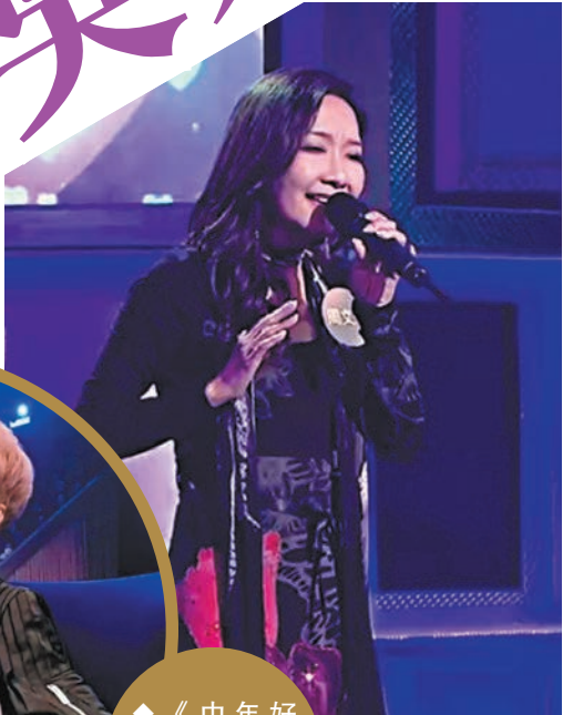
◆《中年好声音2》評審陳慧嫻很投入。