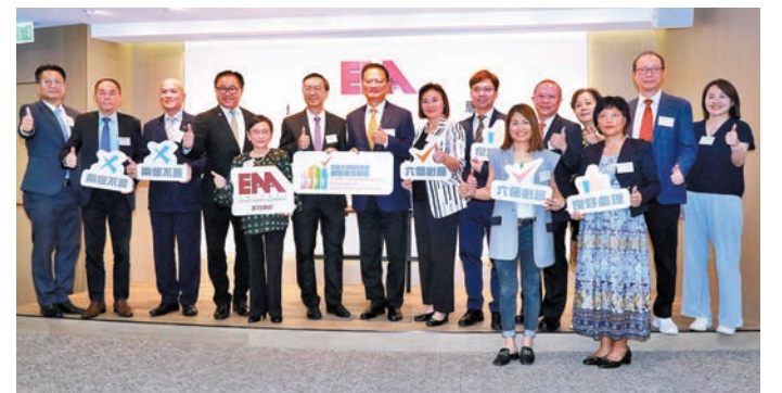
◆地產代理監管局舉行《地產代理良好處理劊房租賃約章》簽署儀式。

據悉，案中首先被捕的 19 歲劫匪與同黨乘私家車逃走後中途擱腳落車，再搭的士到飛鵝山山腳匿藏等候同黨前來分贓。警方重案組探員根據過往經驗，知悉南亞裔幫犯案後多會逃上山林收藏贓物及等候分贓，隨即部署監視附近地區山頭，結果迅速在案發後僅約 1.5 小時後，於百花林路飛鵝山匯豐雙變電站附近一樹下叢草拘捕其中一名劫匪及起回所有贓物。