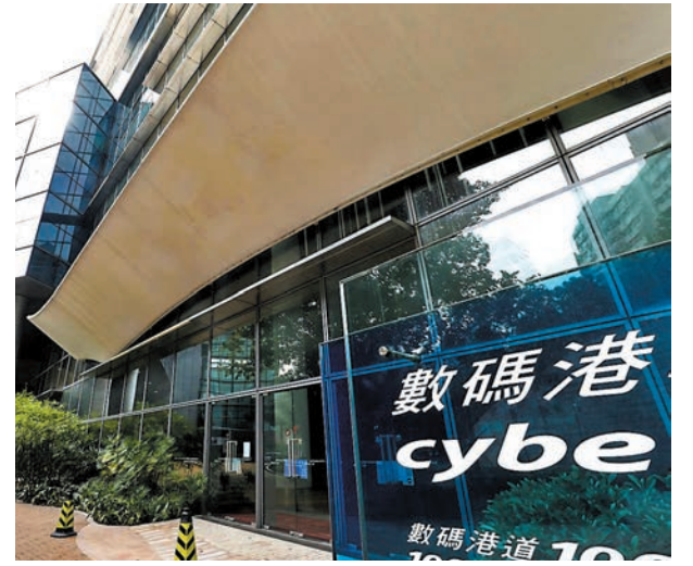
◆數碼港電腦系統被入侵，「暗網」顯示逾400GB個人資料「已洩漏」。資料圖片

他指出，香港目前沒有針對資料外洩的法例和罰則，同類事件通常只由私隱專員公署調查和警告，欠缺阻礙力，亦令企業疏於加強數碼保安。他建議特區政府參考新加坡，一旦公司造成資料洩漏，可被罰款