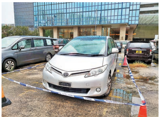
◆前日尖沙咀發生的錶行劫案，警方昨日再拘一名17歲南亞裔少年及尋獲涉案賊車。

香港文匯報訊(記者 蕭景源)尖沙咀廣東道一間錶行，前日遭 3 名持刀鎗的非華裔男匪徒劫去 20 隻總值約 300 萬元的名錶。警方僅隔兩個半小時即閃電破案，先在飛鵝山拘捕一名涉案的 19 歲巴基斯坦裔劫匪及起回全部贓