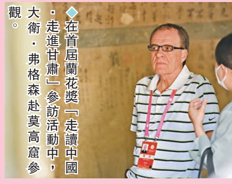
◆在首屆蘭花獎「走進甘肅」參訪活動中，大衛·弗格森赴莫高窟參觀。

過這個城市。南通的人口規模遠高於我的家鄉蘇格蘭，令我倍感震撼。接下來我寫了一本關於蘇州的書，蘇州新舊交融、令人神往，既有保存完好的古城，也有高科技園區，是中國現代化發展的典範之一。」 2020年底，他受邀到甘肅參加扶貧論壇，這也是他第一次真正親眼看到扶貧工作在農村的實踐。「電子商務在中國的脫貧和鄉村振興中發揮了巨大作用，基礎設施的改善和電子商務企業的建立，使村民們能夠與國內外市場對話，這改變了許多村莊的經濟前景。我產生了為甘肅做點什麼的想法，《從貧困到富饒：甘肅美麗鄉村蛻變記》一書由此產生，它詳細介紹了甘肅已經和正在發生的事情。」 他表示，自己的書並不是某個城市或地區的綜合性書籍，而更像是一個縮影，從不同視角展現當代中國的生活、商業、經濟、環境和文化。當一些西方媒體「妖魔化」中國，由此造成普通西方受眾對中國有所誤解時，他提出，西方媒體和政客費時尋找中國的錯誤，這是一種蓄意策劃、故意製造的敵意。因此，中國試圖通過諸理性的話語方式來解決這個問題是行不通的，而是需要一種截然不同的話語方式。「我每次寫關於中國的書時，總是會先挑出西方批評的某些特定領域，並直接回答它。例如在寫甘肅脫貧的故事前，我發現西方總是批評中國虛構數字，於是在我書中正面回應了這個問題。」他補充道，「國際話語是通過英語運作的，英語對中國來說是一門外語，對於一些最直接或批評中國的國家來說則是母語。因此，像我這樣擁有西方文化背景的人應該主動向世界介紹中國，我願意為中國辯護。」