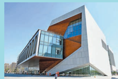
◆天津茱莉亞學院位於天津濱海新區于家堡金融區。

外合作辦學項目——天津茱莉亞學院的各方面發展。目前，天津茱莉亞學院共有來自5個國家和地區的157位在讀大學預科學生，來自中國、美國、泰國等14個國家和地區的79名在籍研究生，已有兩屆研究生順利畢業。「我們的學生來自很多國家，這確實創造了非常有趣的多元氛圍和文化間的交流。」他稱，音樂為中外學生之間創造了一種「奇妙的聯繫」：來自不同國籍、說着不同語言的學生，在一起演奏時，不需要語言便可相互理解。 約瑟夫·波利希認為學院在探索新的藝術和教育舉措方面發揮着「催化劑」的作用：「我們要求學生走向社區，在學校、敬老院、醫院進行演講和表演，將音樂藝術帶給那些通常聽不到我們音樂的社區和聽眾。這對我們的年輕藝術家來說也很重要。因此，他們可以明白自己是真正的傳播者。」同時，他表示中美文化交流需重啟和恢復，音樂作為一種抽象的藝術形式，可以為人們更好地相互了解提供多種途徑，天津茱莉亞學院可以作為中美文化交流的典範。