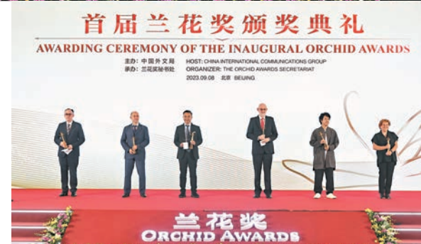
◆九月八日，首屆蘭花獎頒獎典禮在北京舉行。圖為頒獎典禮現場。