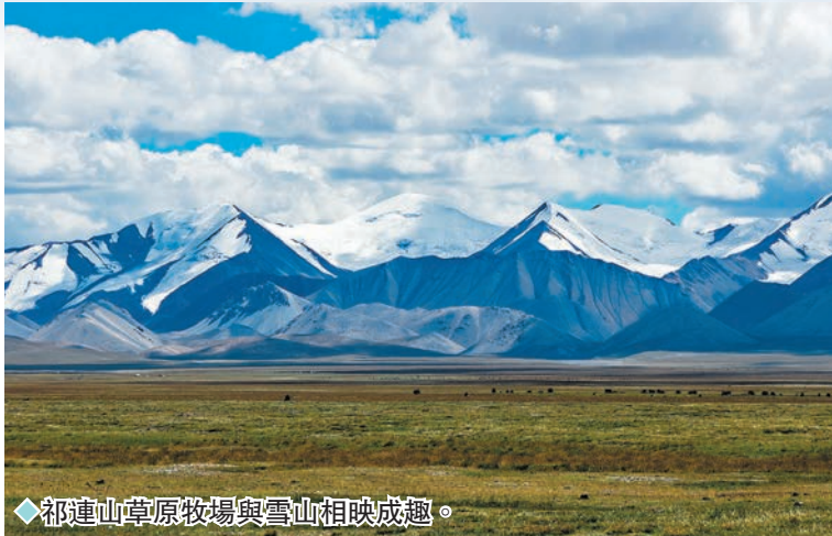
◆祁連山草原牧場與雪山相映成趣。