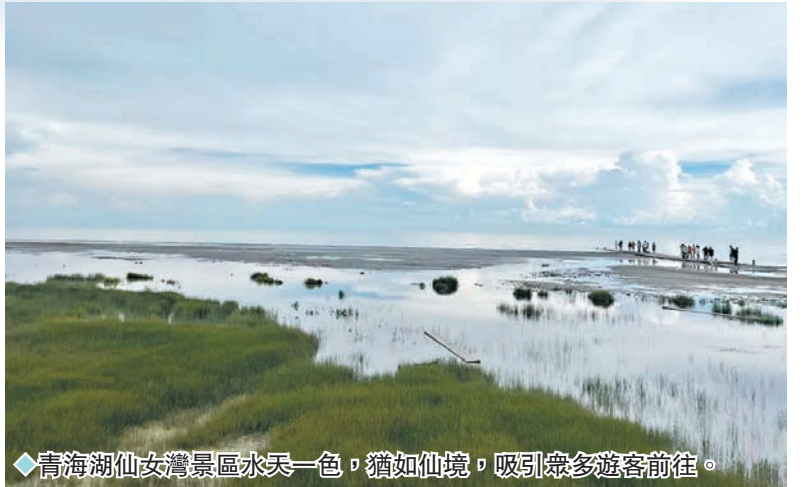
◆青海湖仙女灣景區水天一色，猶如仙境，吸引眾多遊客前往。