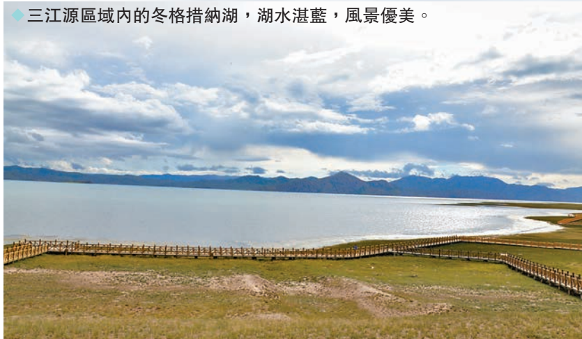
◆三江源區域內的冬格措納湖，湖水湛藍，風景優美。

地處青藏高原的青海省，廣袤草原綿延起伏，蒼涼戈壁無邊無際，萬水千山雄渾壯麗，充滿浩然之氣與和諧之美。多種多樣的地形地貌、多姿多彩的高原景觀、種類繁多的野生動植物，讓這裏成為了國家公園的聚集地，三江源國家公園、祁連山國家公園（青海片區）、青海湖國家公園（創建中）齊聚。甫一走進青海，遊客便置身美景之中，感受着來自青藏高原的壯美。