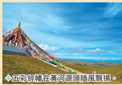
◆五彩經幡在黃河源頭隨風飄揚。