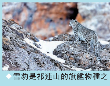
◆雪豹是祁連山的旗艦物種之一。