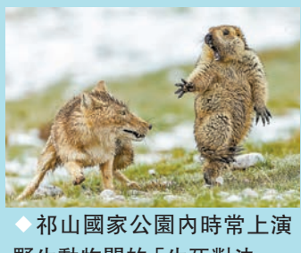
◆祁山國家公園內時常上演野生動物間的「生死對決」。