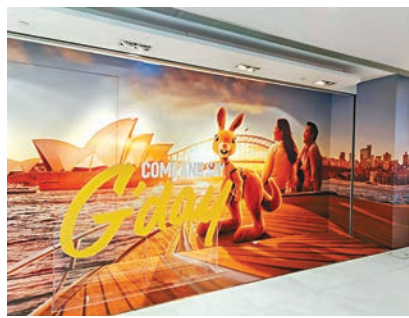
◆以悉尼海港為背景的「澳洲拍攝區」。

由即日起至10月6日，Ruby的「旅行紀錄」於「澳洲體驗館」播放，市民可現場免費獲取及集齊8款紀念明信片，收藏Ruby和Louie見過的美景。大家更可在二樓及地下的兩個、以悉尼海港為背景的「澳洲拍攝區」與Ruby合影。此外，可愛的Ru-