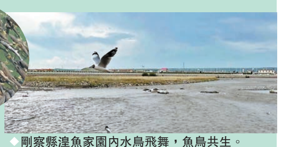
◆剛察縣湟魚家園內水鳥飛舞，魚鳥共生。