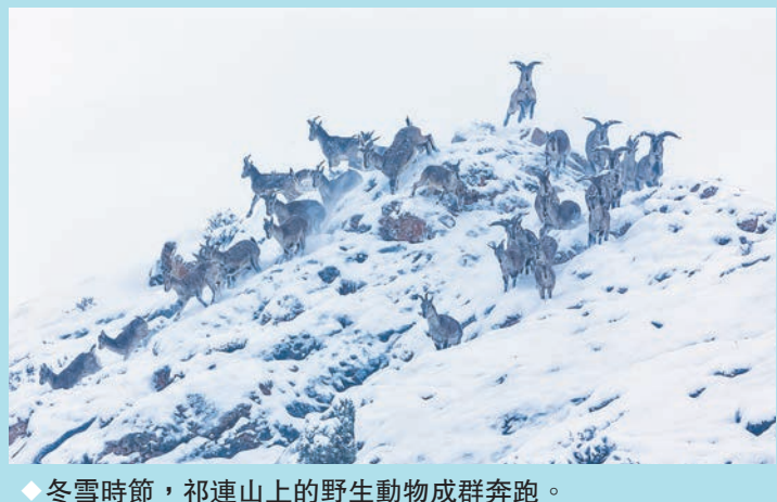
◆冬雪時節，祁連山上的野生動物成群奔跑。

這裏同時也是野生動植物的樂園。在祁連山，不僅有雪豹、野驢、白唇鹿、林麝、馬麝、黑頸鶴等旗艦物種，還有荒漠貓、禿鶯、藏野驢等眾多國家級保護動物。行走在祁連山間，不經意間，或許就能邂逅這些野生動物。