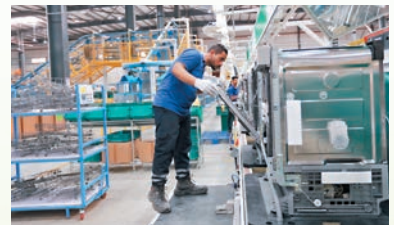
◆中企在埃及開設的洗碗機生產線

◆深入開展教育、科學、文化、體育、旅遊等領域合作，打造一批小而美民生工程，通民心、達民意、惠民生，探索了促進共同發展的新路子