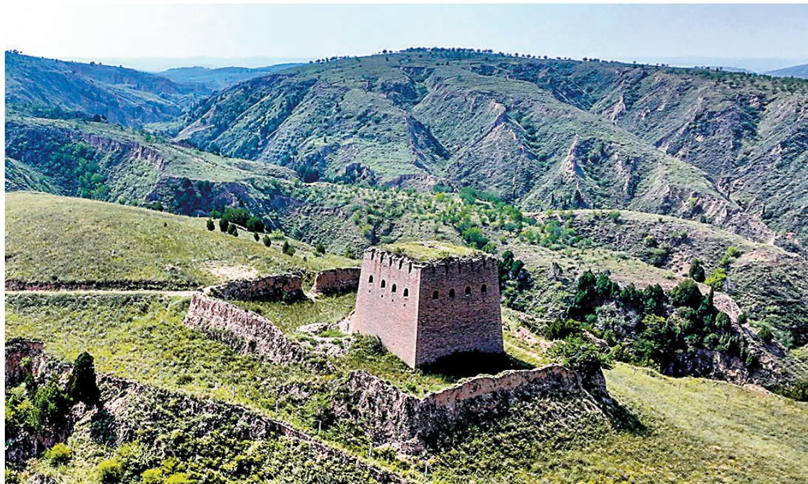
◆位於陝西的明長城烽火台遺址。

第三個破綻與歷史學的概念有關。 學術界存在一個共識名為孤證不立，意指如果只有一條證據支持某個結論，這個結論是不可以接受的。《史記》關於烽火戲諸侯的故事疑點重重，又未有其他證據可以互相佐證，基本上嚴謹的史學家會將之排斥出歷史真相。2012年，中國出土了一批竹簡，內有記載周幽王末年事跡，其滅亡原因並非「烽火戲諸侯」而另有他因，這點與另一本古書