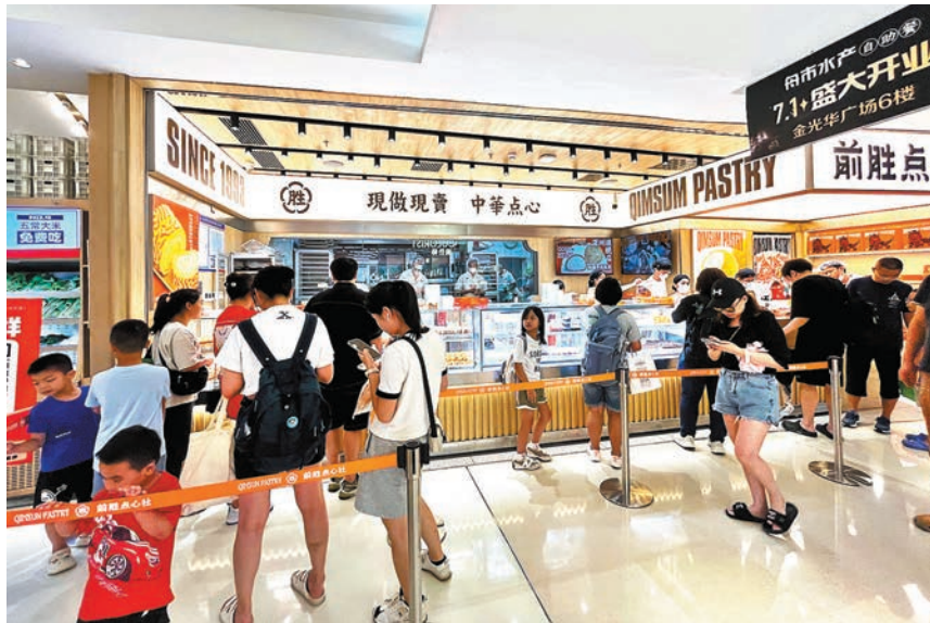
◆深圳國貿金華廣場，每到周末吸引眾多港人打卡消費。

據悉，未來人民銀行深圳市分行、市地方金融監督局等部門將繼續開展系列活動，實現數字人民幣紅包「境外領取」「境內核銷」，推出數字人民幣硬錢包交通聯名卡，為來深港人使用公共交通提供便利和優惠。