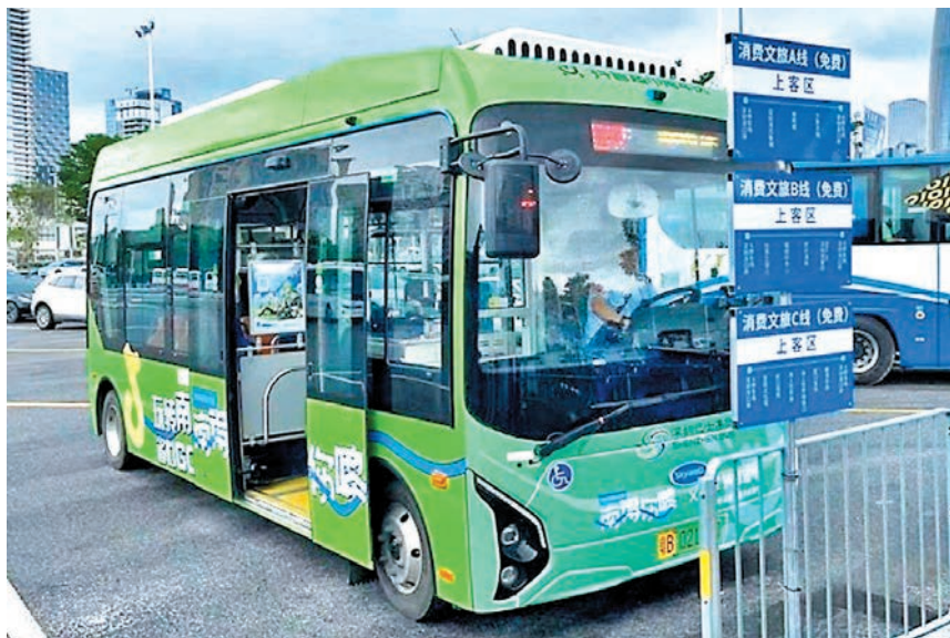
◆深圳巴士集團開通了口岸穿梭巴士線路，串聯羅湖口岸、文錦渡口岸、福田口岸，途經國貿、東門、筲崗等港人熟悉的重點商圈。圖為接駁巴士。