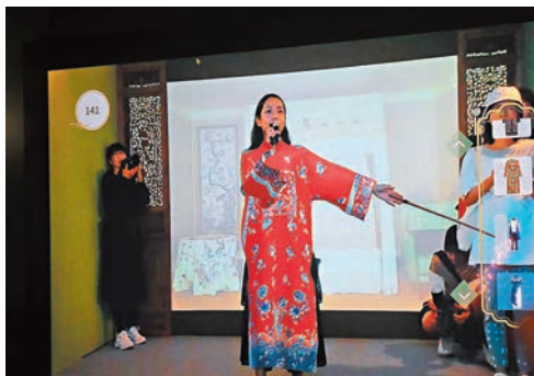
◆香港藝術館與香港理工大學師生合作的虛擬時裝秀