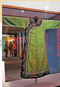
◆獲西方女性喜愛的中式服裝

式女服，設計寬鬆自在。寶藍色絲綢面料彩繡四季花卉和各式花籃圖案，寓意四季長春、花開富貴。在19世紀後期，中式服裝成為新興外銷商品，這類剪裁寬鬆、富有東方韻味的服裝，更成為西方女性理想的晨服和睡袍款式。