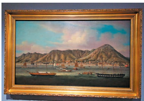
◆油畫作品《維多利亞遠眺》(1854) 香港藝術館藏品