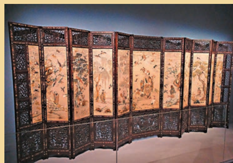
◆廣繡八仙賀壽圍屏 (1644-1911) 廣東省博物館藏品

展覽中的一間「中國風」房間，由各式絲綢製品裝飾而成，足見當時絲綢作為文化交流的媒介所發揮出的巨大作用。