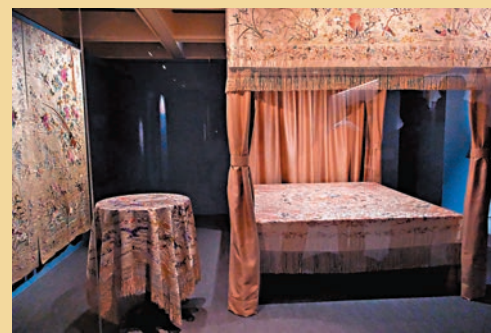
◆備受喜愛的「中國風」家居