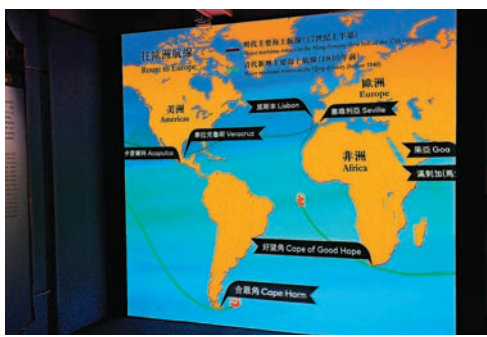
◆可互動的外銷航線展示屏