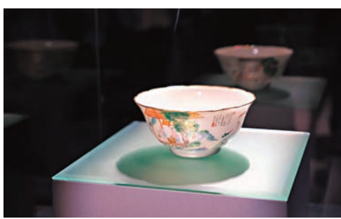
◆粉彩描金耕織圖花口碗 清乾隆(1736-1795) 澳門博物館藏品