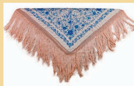
◆米白色網地三藍繡牡丹紋披肩 (1850-1860)

到19世紀，中式服裝成為新穎的外銷品。在歐洲有些貴婦甚至穿着帶有中國刺繡的服裝和圍巾，和繡有麒麟、龍鳳等圖案的鞋子，將自己打扮成中國傳統大家閨秀的模樣。同時，外銷市場亦出現中西融合的時髦服飾設計。展覽中展出的一件藍緞地繡花蝶紋女服，便是一款左右開襟，寬身闊袖的中