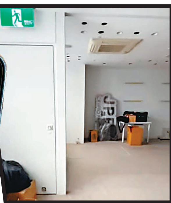
◆JPEX在台灣地區的辦事處人去樓空。

JPEX在過去一段時間非常高調宣傳，不惜大灑金錢在電視頻道、大廈外牆、的士車身、港鐵月台，甚至早前的灣仔電腦節亦有其疑似合作夥伴擺檔拉客，更請來多位演藝界名人及KOL做宣傳，在鋪天蓋地的宣傳攻勢下，不少苦主一開始相信該平台已獲牌照。