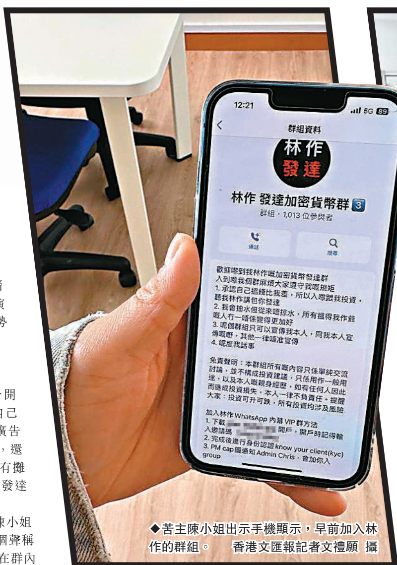
◆苦主陳小姐出示手機顯示，早前加入林作的群組。