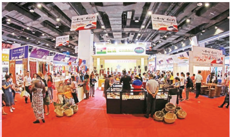
◆ 中國—東盟博覽會「一帶一路」國際展區。

隨着中國—東盟自貿區3.0版、RCEP和「一帶一路」建設深入推進，東博會將繼續高質量服務國家戰略落地，助推廣西高水平開放和高質量發展。