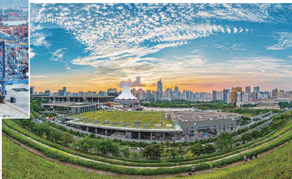
◆ 中國—東盟博覽會永久會址南寧國際會展中心。