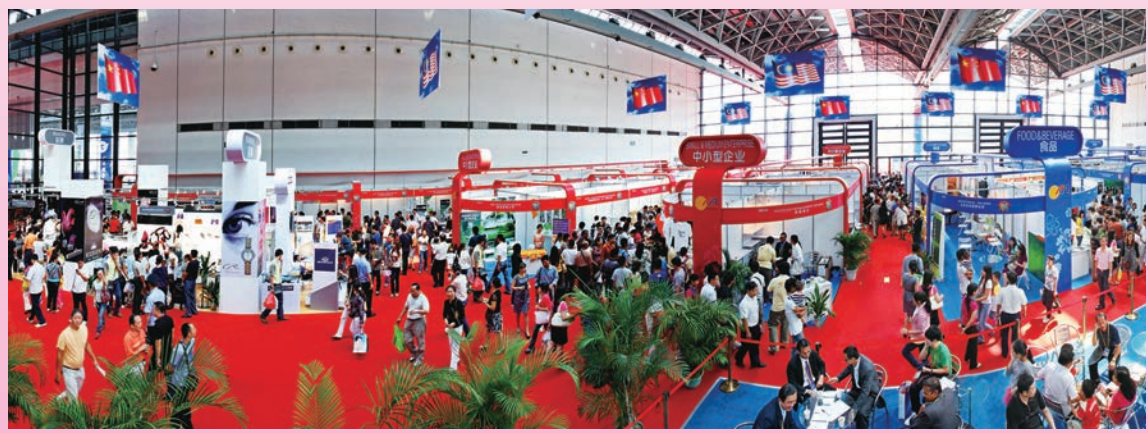
◆ 中國—東盟博覽會商品貿易專題東盟商品展區。

如今，依託東博會，一大批產業正在廣西迅速崛起。廣西，正從一個經濟欠發達的省份逐漸變成海內外投資者的熱衷地。