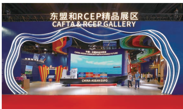
◆ 中國—東盟博覽會東盟和RCEP精品展區。