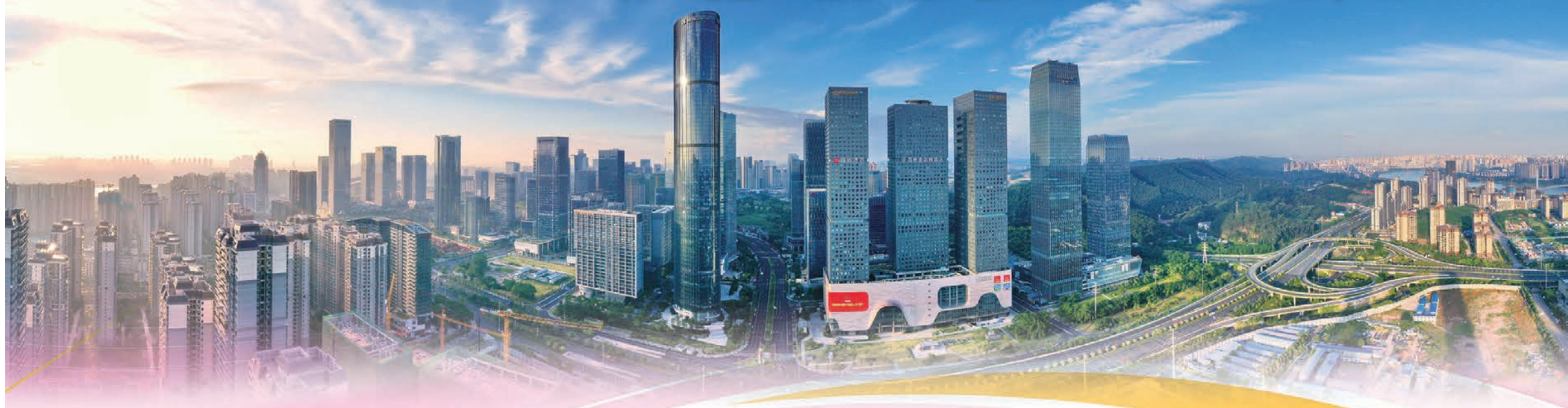
◆ 中國（廣西）自由貿易試驗區南寧片區新貌。

廣西是中國唯一同東盟陸海相連的省份，走兩步就是東盟。習近平總書記對中國—東盟博覽會、中國—東盟商務與投資峰會寄予厚望，深刻指出其已成為廣西亮麗的名片，也成為中國—東盟重要的開放平台。