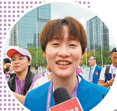
羽毛球奧運冠軍陳雨菲接受記者訪問。

香港文匯報訊(記者 俞畫 杭州報導)杭州亞運會亞運村開村儀式暨中國體育代表團歡迎儀式昨日上午在亞運村旗幟廣場舉行。在歡迎儀式上,杭州市人大常委主任、亞運村村長李火林致歡迎辭,熱烈歡迎中國體育代表團入村,並表示亞運村將按照「以運動員為中心,以服務賽事為核心」的辦村宗旨,盡最大努力完善家的功能、營造家的氛圍、提供家的服務。