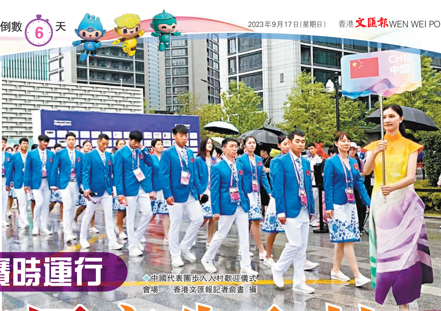
中國代表團步入入村歡迎儀式會場。香港文匯報記者俞畫攝